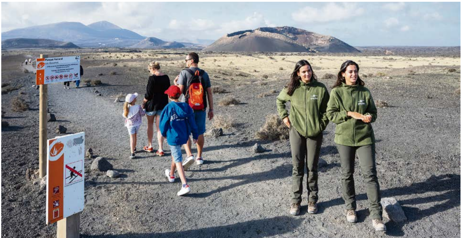
Las informantes atienden cada día a centenares de visitantes.