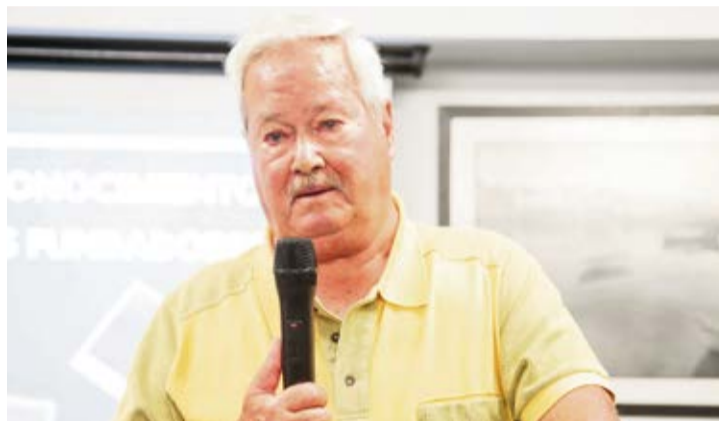
El actual presidente Pepe Tabares.

El bar hizo un millón de pesetas vendiendo solo cerveza, pejines y pollo al ajillo