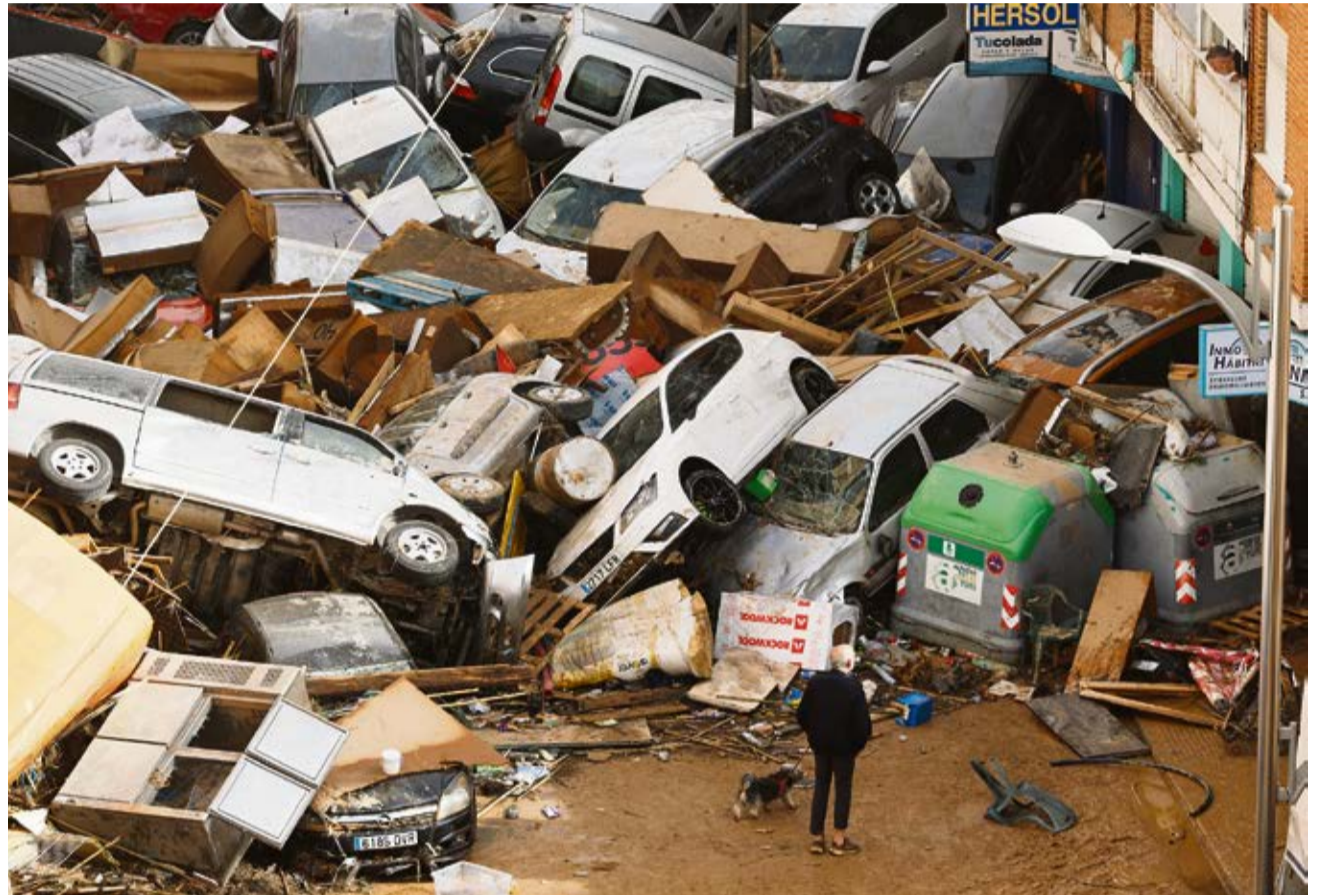
Vehículos amontonados en una calle tras las intensas lluvias.

Qué tramposa es la política, no por culpa (en exclusiva) de sus principales actores, sino porque convive con un elemento tan caprichoso como la incertidumbre. Las portadas de antes de ayer se han quedado viejas de golpe y la atención se ha apartado por completo de Koldo, Begoña, el novio de Ayuso, Errejón y el fiscal general, que acaparaban titulares en los viejos tiempos (viejos, o sea, hace un par de días) de la realidad precocinada. Porque cuando la realidad en estado puro se abre paso, la otra, la diseñada en los gabinetes que se ganan la vida a través de eslóganes, queda por completo en evidencia. De repente nos hemos dado cuenta de lo obvio, de que la política y la gestión pública va de afrontar situaciones que uno no espera ni ha planificado, o de abordar problemas reales (como la vivienda) que no dictan sentencia a través de titulares favorables ni mensajes ingeniosos en las redes sociales. Porque cuando arrecia la lluvia y sorprende a un territorio densamente poblado, como es el caso de la Comunidad Valenciana, entonces es cuando la tarea pública cobra todo su sentido y rompe