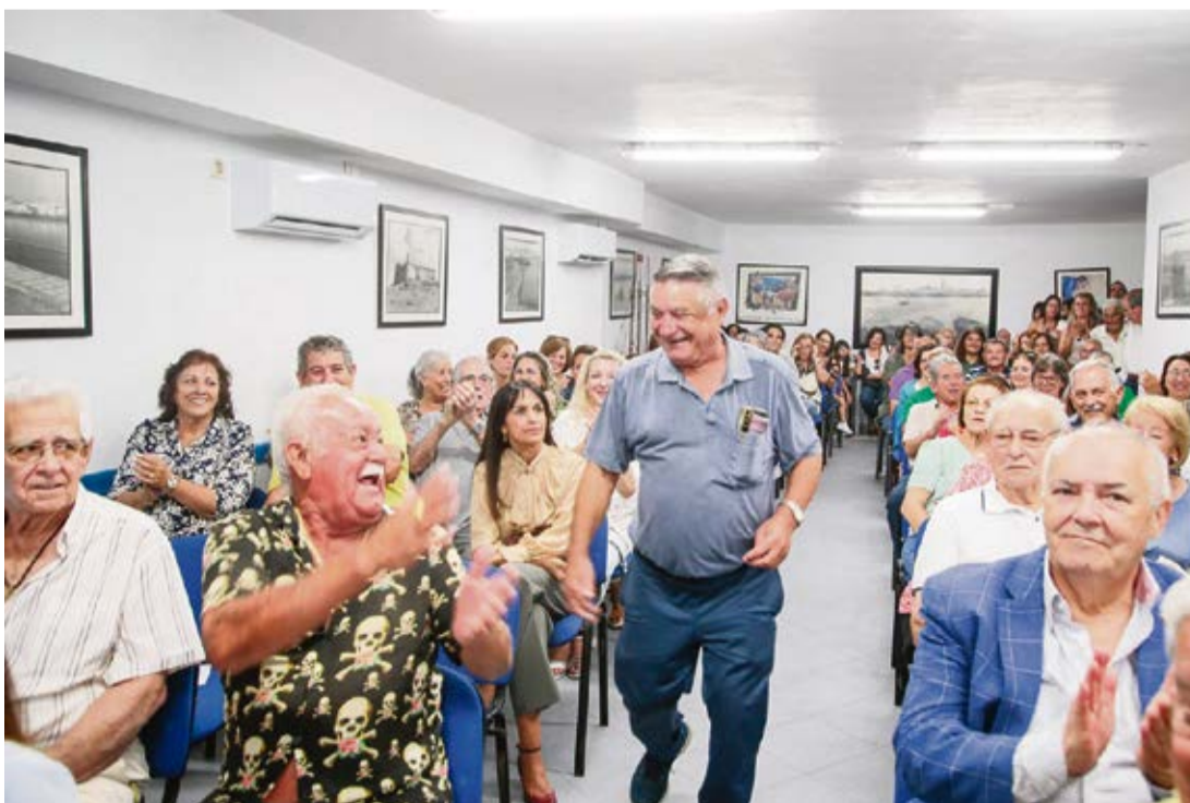
Al acto acudieron numerosos socios y amigos.

Llegaron a participar en un partido de fútbol disfrazados de escoceses