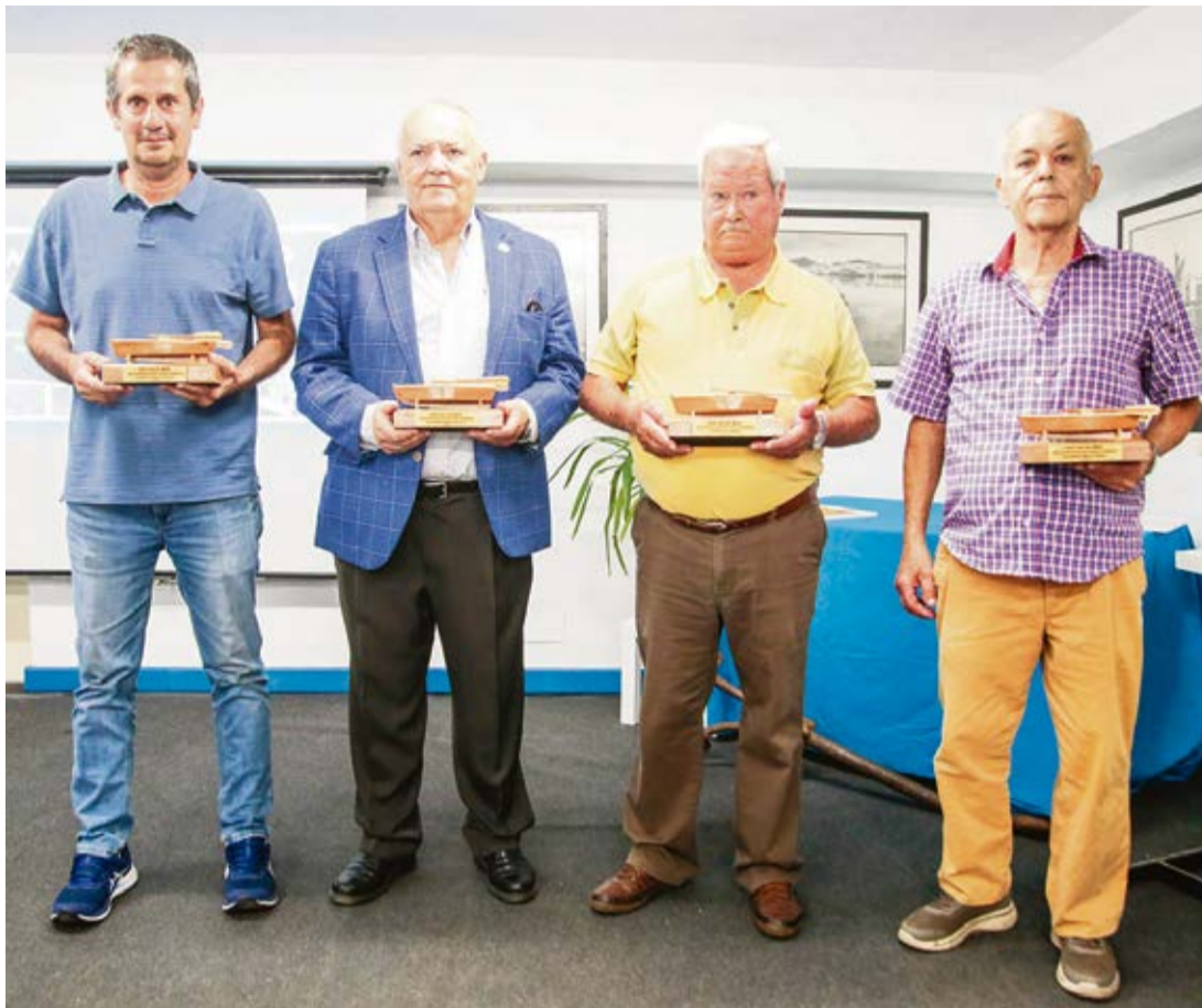
Algunos de los expresidentes de la Casa del Miedo o sus familiares.

Por entonces, cuando le pidieron la colaboración al concejal, estaban provisionalmente en otra sede, justo al lado, en Casa Amelia, y habían puesto la mirada en ese pequeño llano en la ribera del Charco. Al Ayuntamiento le pareció bien y no solo cedió el suelo, sino que construyó la estructura del edificio, “las paredes y el techo”, recuerda Esteban. El resto lo hicieron los socios, concretamente 42, y sufragaron los materiales con un dinero que habían