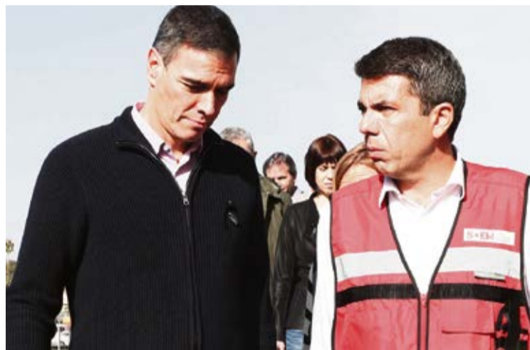
El presidente del Gobierno, Pedro Sánchez, acompañado por el president de la Generalitat, Carlos Mazón.

ranza que visos de realidad, la posibilidad de obtener una respuesta conjunta de los poderes del Estado, tanto el estatal como los autonómicos, a través de una reforma de la Ley de Extranjería que haga posible la tutela responsable de los menores inmigrantes por los gobiernos autonómicos, por ser competentes en materia de protección del menor. Se trata, sin duda, de un marco legal diseñado para la atención a la infancia autóctona, y en modo alguno fue pensado para contemplar y asumir el estallido de la crisis migratoria en toda su dimensión. Sea como fuere hasta la fecha ha sido imposible reformar las normas y es Canarias la que aborda en solitario esta situación sobrevenida, sostenida en el tiempo y que supera las capacidades objetivas de la Comunidad Autónoma. Se trata, sin embargo, de un asunto gestionable desde una perspectiva conjunta, de Estado, con la implicación sincera, y hasta el momento ausente de las restantes autonomías. Y así nos hemos movido hasta la fecha.