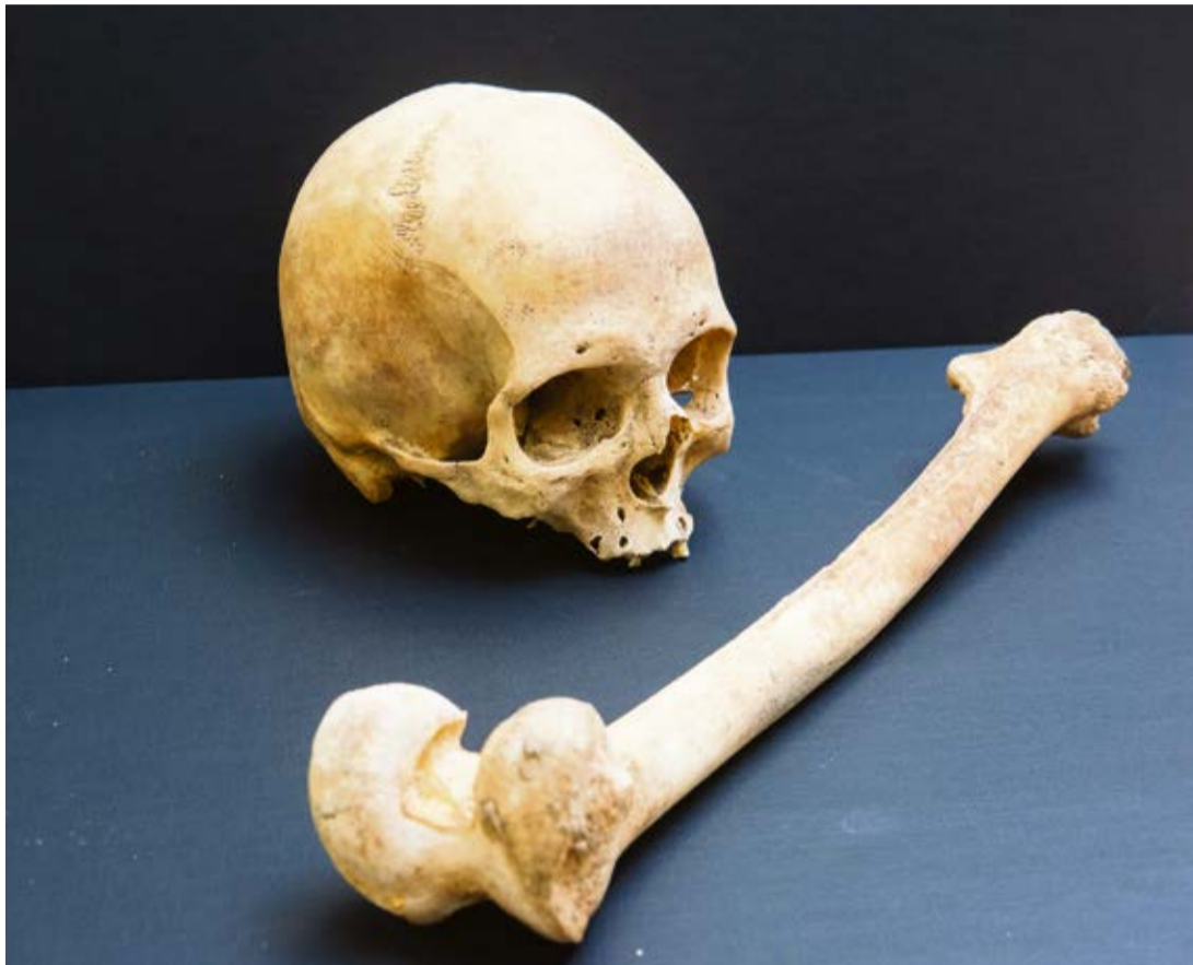
Cráneo encontrado en una cueva en Punta de los Caletones.

Las investigaciones sobre los antiguos pobladores en Lanzarote y Fuerteventura se multiplican en los últimos años a pesar de la escasez de restos humanos