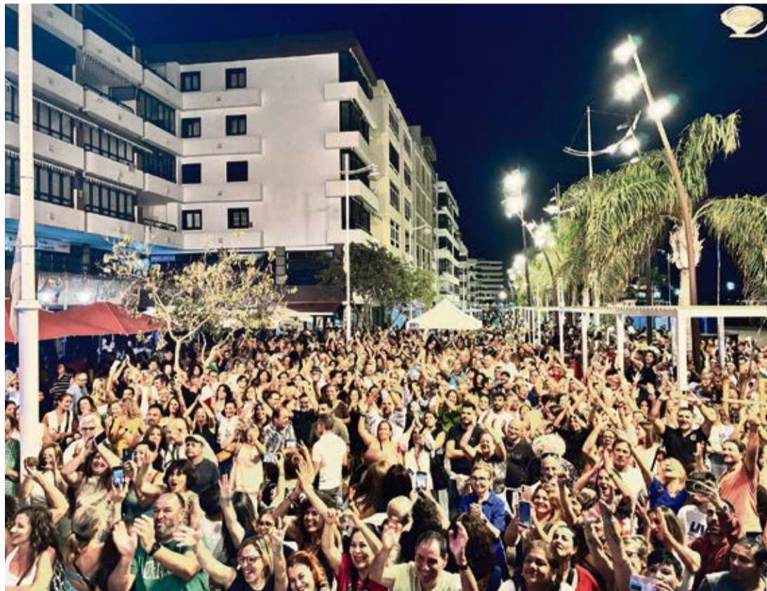
Fiesta celebrada en octubre en la Avenida, frente a la playa de El Reducto.

Nace en Arrecife una iniciativa vecinal para reclamar soluciones contra el ruido excesivo en la capital y estudian acciones legales