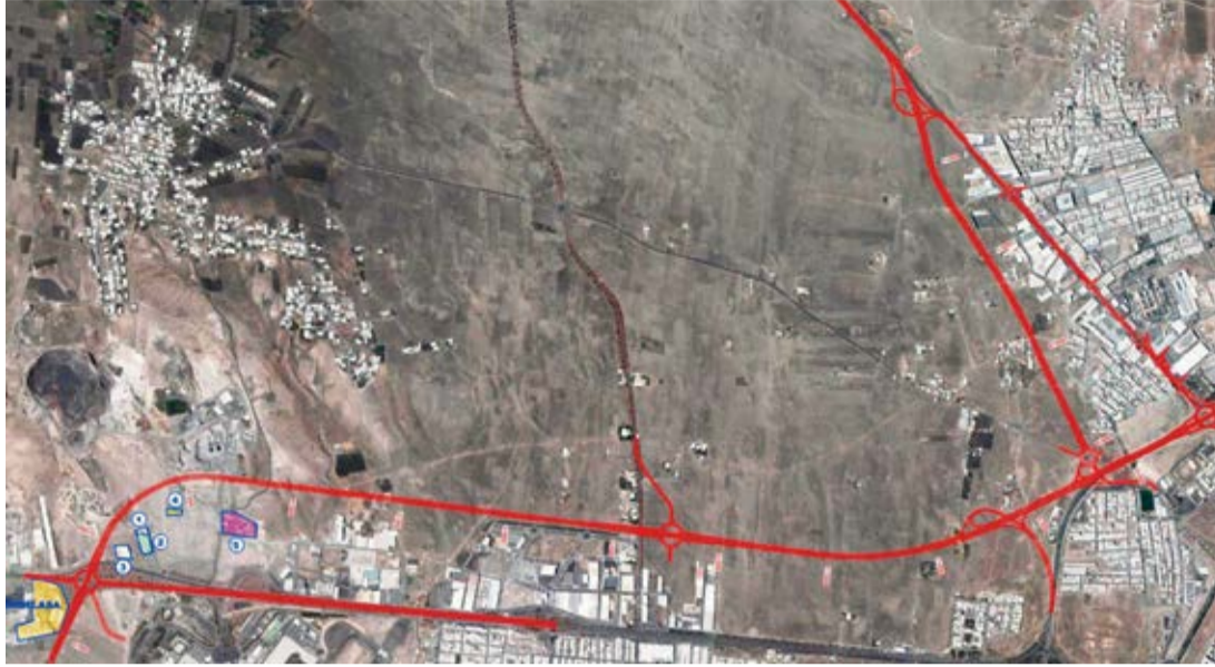
Trazado de la LZ-5, a lo largo de más de ocho kilómetros por suelo rústico.