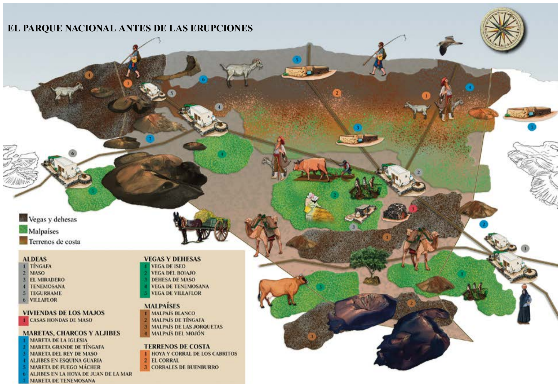
Mapa ilustrado de Juan Antonio Cabrera sobre lo que había antes de las erupciones en la zona que ocupa hoy el Parque Nacional.