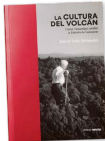
Portada de ‘La cultura del volcán’.

José de León refrenda con múltiples testimonios como los residentes de los pueblos más cercanos empezaron a aventurarse por los kilómetros de duro lajjal: los campesinos escudriñaron chabocos o rincones para plantas higueras y otros frutales, las aldeanas abrieron