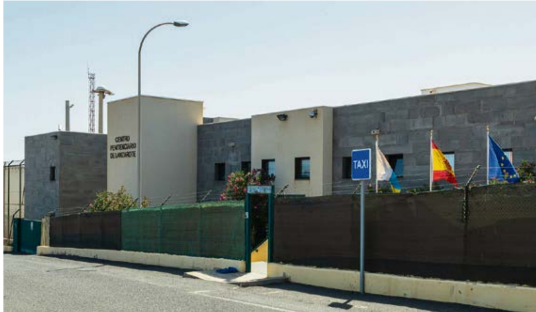
Centro Penitenciario de Tahíche.

protección internacional”, señala esta abogada. El joven llegó a Lanzarote, pero lo trasladaron a la cárcel a Tenerife, aunque su caso permaneció en un Juzgado de Arrecife. La prueba ósea radiográfica determinaba una horquilla de edad con mínimo de 16,5 años “El Juzgado -señala Rodríguez- siguió pidiendo pruebas innecesarias porque ya se acreditaba que podía ser menor, ya que ante la duda la Ley de Extranjería dice claramente que hay que atender a la horquilla mínima”. El artículo 190 del Reglamento de la Ley sobre derechos y libertades de los extranjeros en España y su integración social señala que “en caso de que la determinación de la edad se realice en base al establecimiento de una horquilla de años, se considerará que el extranjero es menor si la edad más baja de ésta es inferior a los dieciocho años”. Pero, en este caso, se pidió otro informe pericial y el personal de dicho Juzgado le comunicó extraoficialmente que al magistrado no le parecía bien la norma y que no iba a aplicar el 190 “porque si eso fuera así, todos serían menores”.