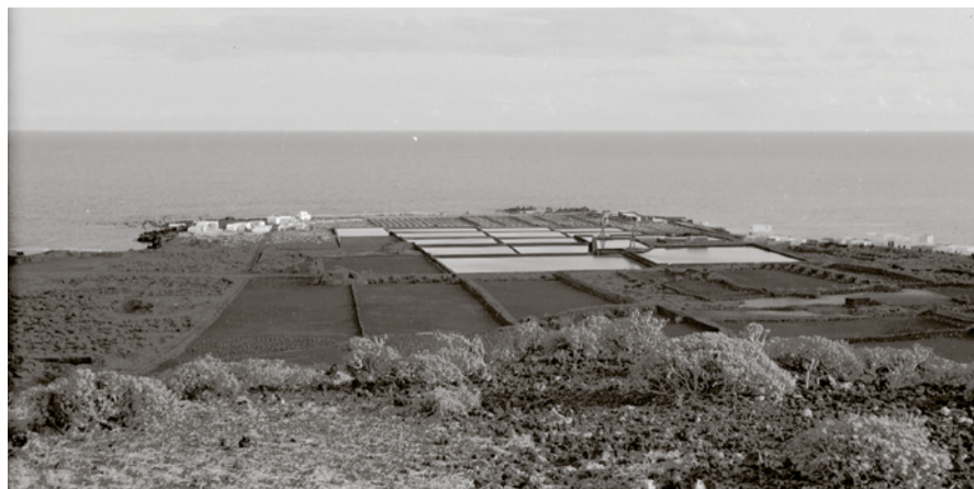
Fotografía de las antiguas salinas de Punta Mujeres en los años 50.

Además de las ya nombradas salinas de El Río, mencionadas en distintos siglos por autores co-