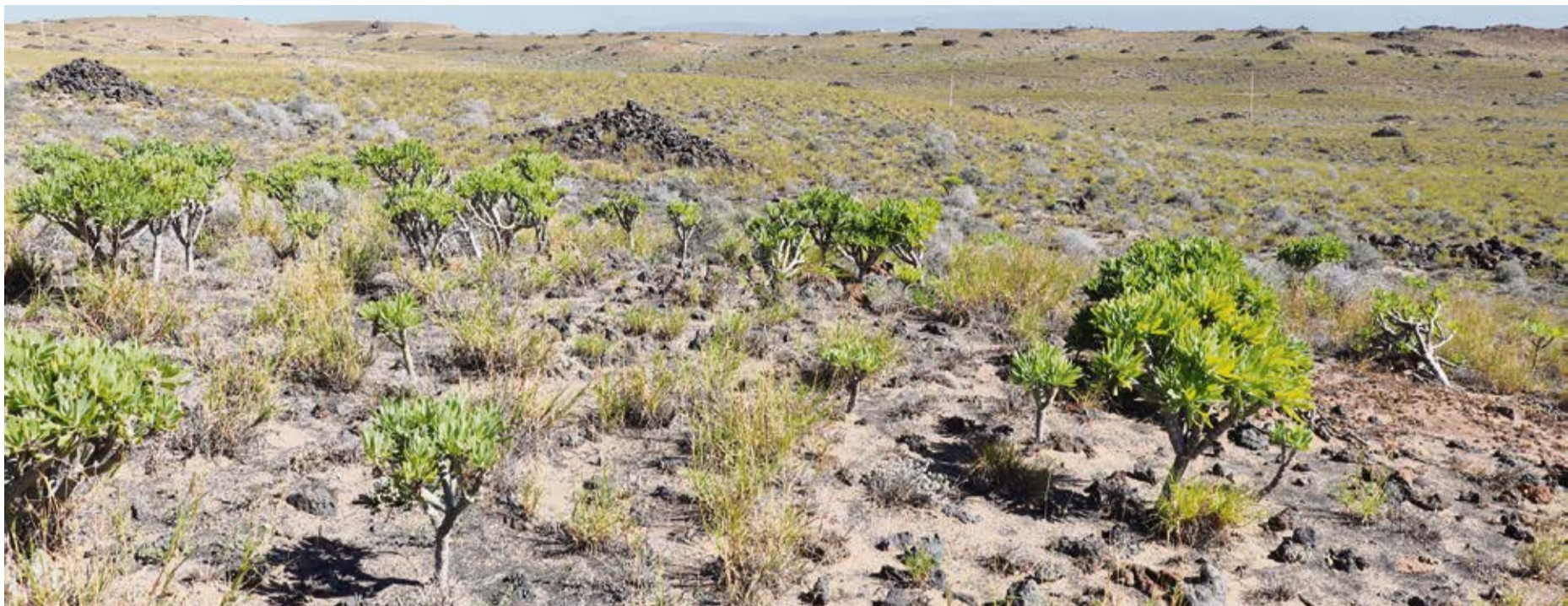
Suelo rústico con jable que quedaría arrasado por la futura autovía LZ-5 entre Playa Honda y Arrecife.