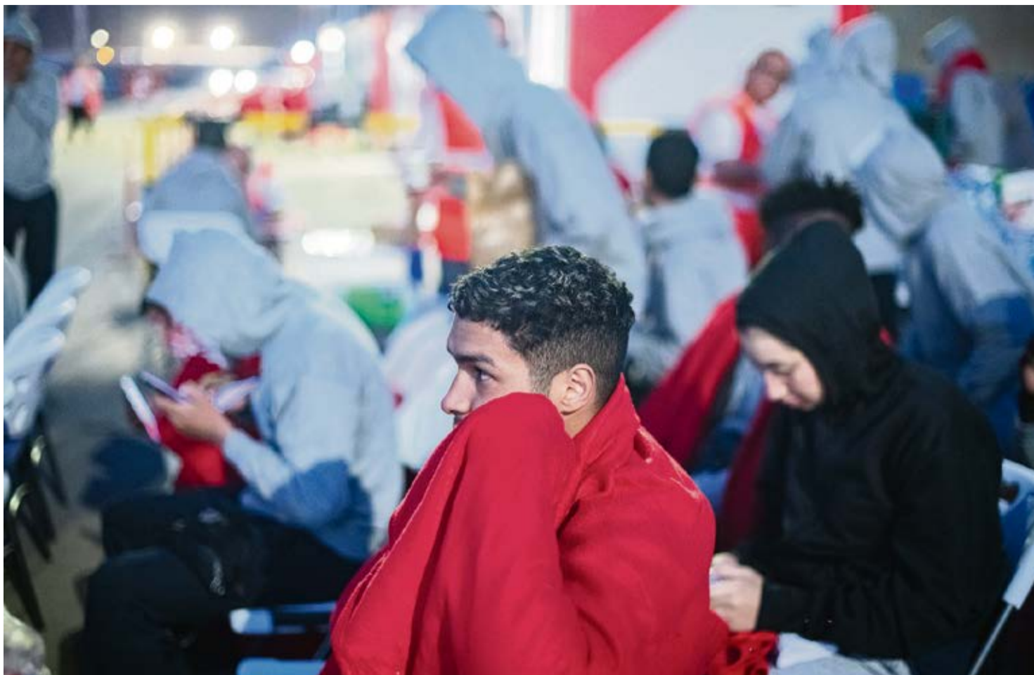
Jóvenes llegados en patera a Fuerteventura.

Uno de ellos dijo que tenía 25 años, cuando en realidad tenía 15, pero también dijo en otro momento que había nacido el 31 de diciembre de 2008, que finalmente era su fecha de nacimiento real, e incluso aceptó en su