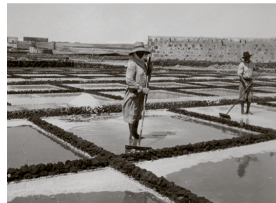
Una mujer y un hombre trabajan en las Salinas de Puerto Naos en los años 50.