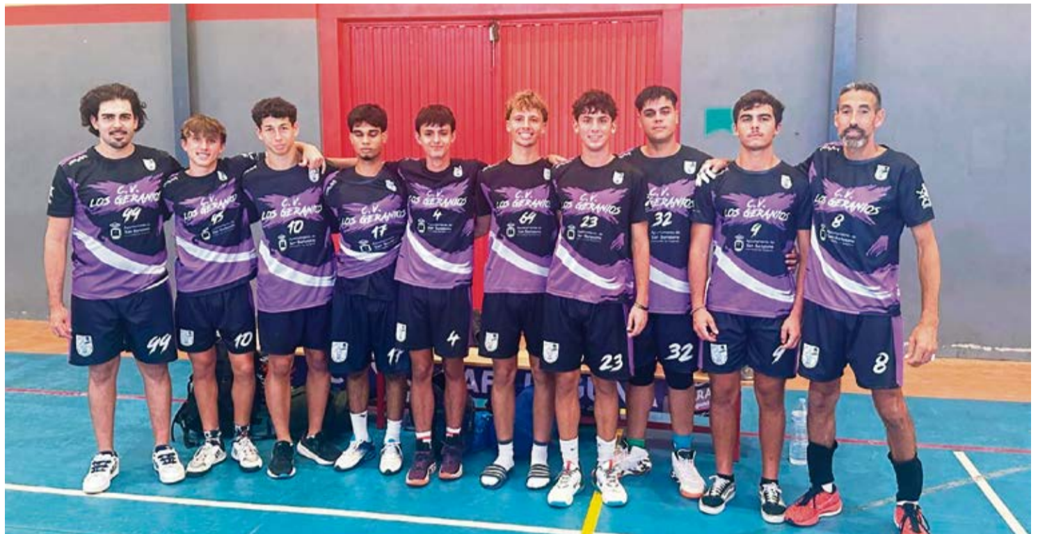
Equipo sénior del Club Voleibol Los Geranios.

El Club Voleibol Los Geranios recupera esta temporada un equipo sénior masculino tras más de una década de ausencia en esa categoría