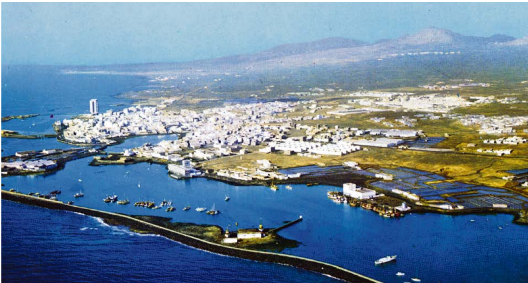
Postal área de Arrecife de principios de los años setenta, con varios complejos salineros por la costa.