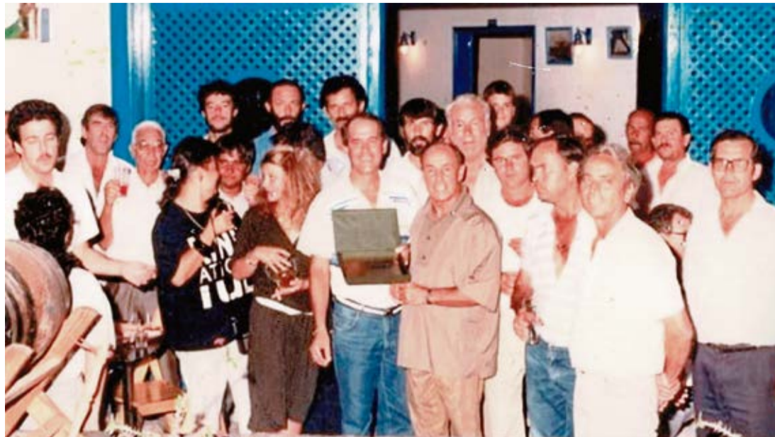
Imagen de la inauguración de la sede en 1987.