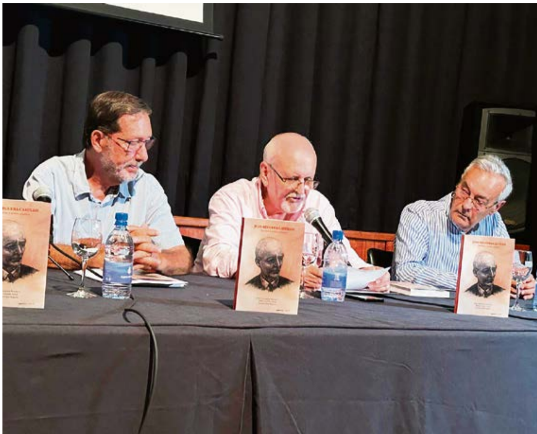
Los tres autores durante la presentación.

El Servicio de Publicaciones del Cabildo edita un libro que recuerda la figura de Juanele, artista y profesor de dibujo