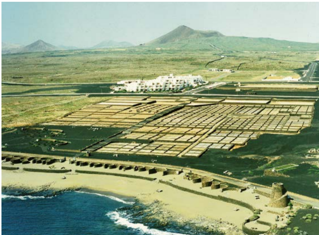
Imagen de las salinas que había en la zona de Playa Bastián de Costa Tegui.

El verdadero apogeo se produjo en la primera parte del siglo XX, con la pesca en la cercana costa africana en progresivo aumento por el empuje de los marineros y empresarios conejeros. Efectivamente, Lanzarote se va a convertir en el gran foco salinero de Canarias, con Fuerte-