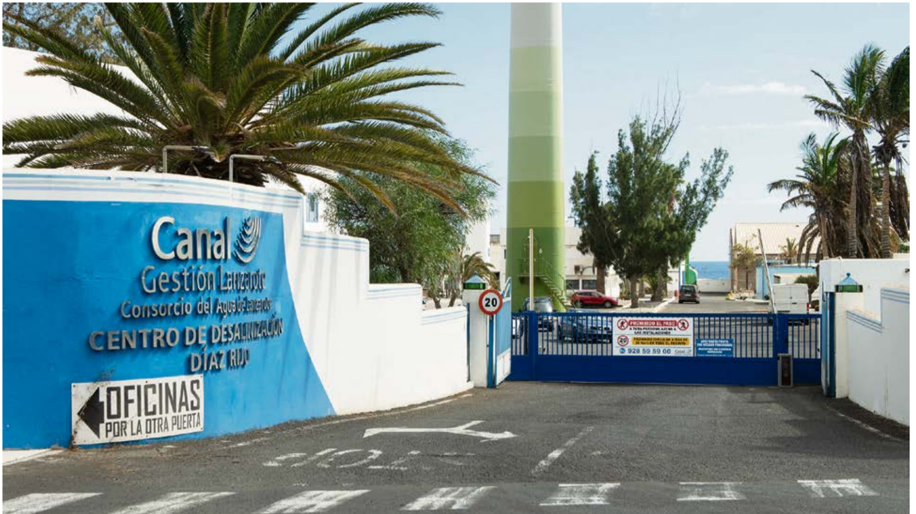
Central de desalación Díaz Rijo.