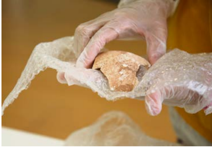
Restos óseos encontrados en el Barranco de La Torre (Antigua) en 2021, que podrían ser de un enterramiento aborigen.

El poblamiento y la estancia de los antiguos canarios se siguen estudiando desde distintas disciplinas, tanto de la arqueología como de la historia. Apunta Rodríguez-Maffiotte que en cualquier población insular hay adaptaciones biológicas y adaptaciones sociales y que hay que seguir estudiando el contacto de los indígenas con europeos o africanos porque “tiene una gran trascendencia no sólo por la transculturación o aculturación en muchos casos, sino también por los asuntos biológicos, la mezcla de poblaciones o la importación de las enfer-