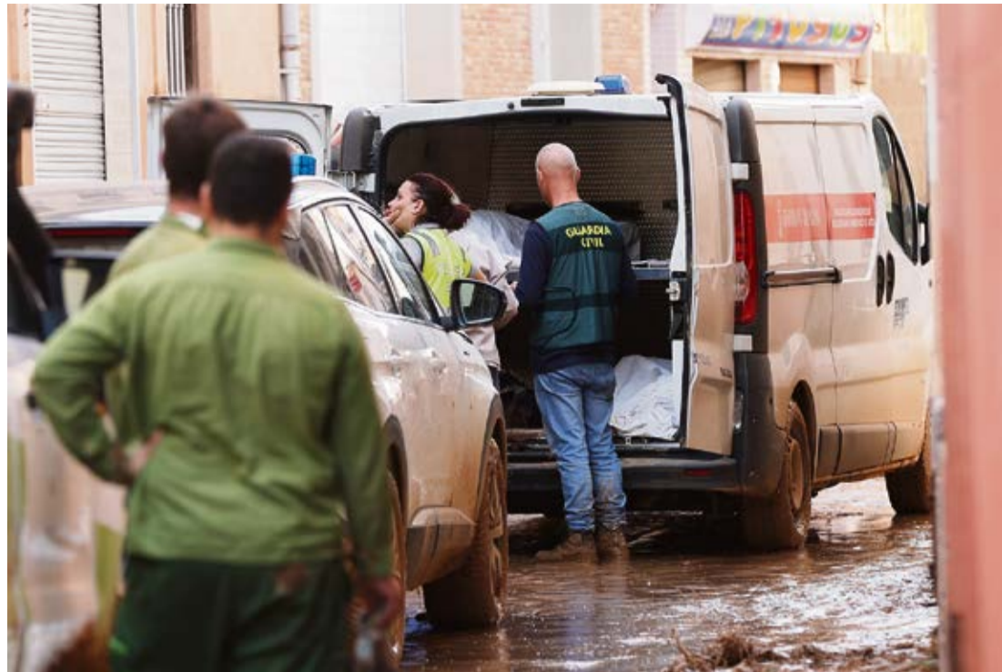
Guardia Civil y los servicios funerarios tras retirar los restos mortales de una persona.

Los asuntos de la agenda política, y digo de cualquier agenda política, cambian en su prelación de acuerdo con la evolución del tiempo y los acontecimientos. En Canarias hay un asunto que ha dominado el panorama durante los últimos meses, durante casi un año incluso. Se trata, obviamente, de la crisis migratoria y su derivada, la acogida de los menores foráneos llegados a las Islas por mar a bordo de pateras y cayucos. Durante meses hemos acariciado, quizá con más espe-