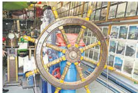
TIMÓN DE MADERA Pieza de barco desconocido, procedente de un desguace en Puerto Naos. Mitad del siglo XX.