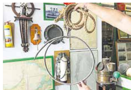
LAVADOR DE PESCADO Gancho metálico en el que se engarzaban por el ojo los pescados ya arreglados para proceder después a un lavado en el agua de mar.