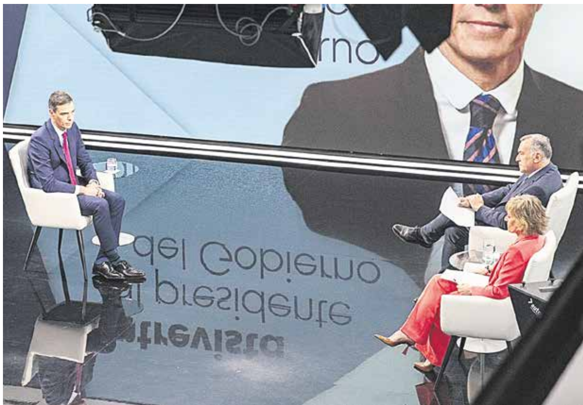
Pedro Sánchez, en la entrevista en 'La 1' de RTVE.

Hay un cierto tono impúdico en las palabras de Pedro Sán-