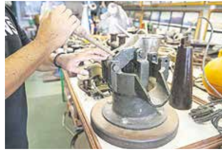
BOMBA DE ACHIQUE DE CUBIERTA Herramienta que sirve para achicar agua de la embarcación o para el vaciado de los tanques.