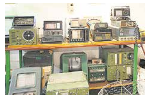
RADIOS Y SONDAS DE PAPEL Tecnología eléctrica para conocer la profundidad del fondo marino y de transmisión de mensajes a tierra y a otras embarcaciones. Mitad del siglo XX.

raciones que está al borde de la desaparición física y de la memoria colectiva”, se duele.