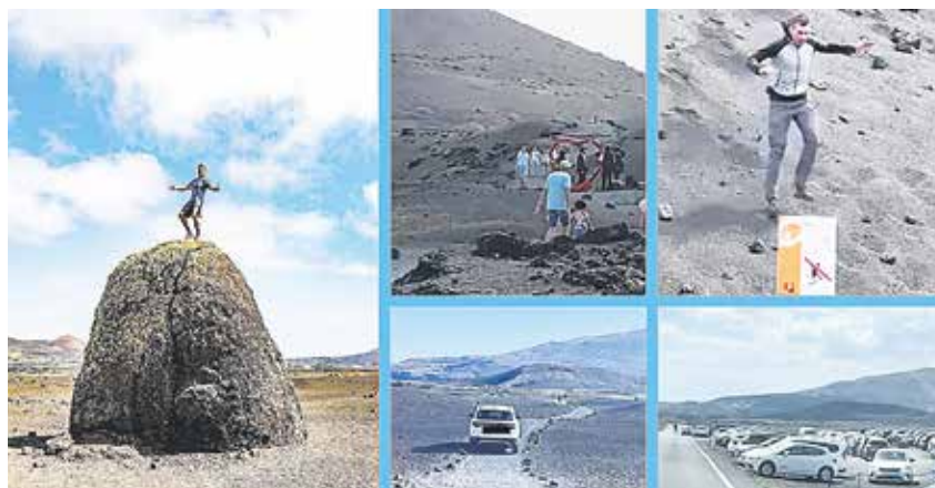
Ejemplos de atentados medioambientales en los espacios protegidos.

El aumento de los casos alarma a los expertos porque se producen principalmente en zonas protegidas de las Islas