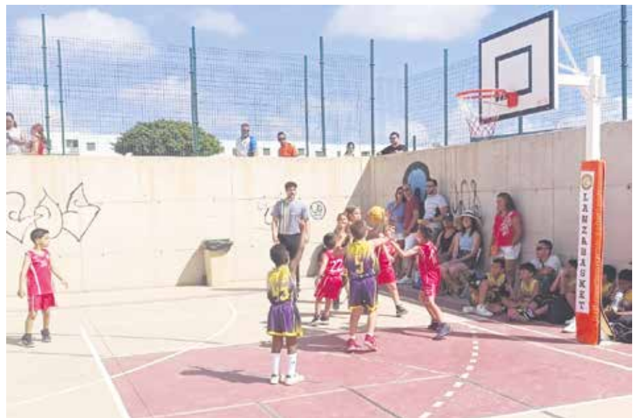
Equipos de Lanzabasket Argana en plena competición.