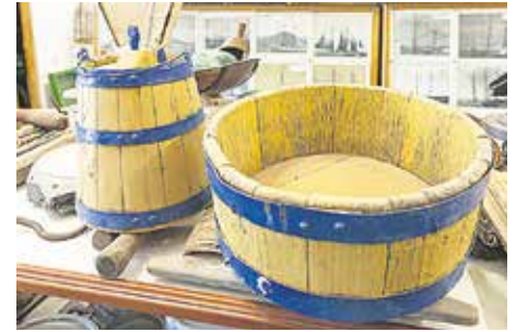
ENSERES Piezas de la vida a bordo. Batea para la elaboración del gofio, a la derecha, y porrón de agua.