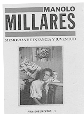
Portada del libro de memorias de Manolo Millares donde cuenta la experiencia de destierro a Arrecife de su familia.

No obstante, el uso de ambas islas como plaza para desterrados políticos se hizo recurrente en el siglo XX, cuando distintos gobiernos usaron estas islas para confinar a enemigos políticos. En 1924, tras amplias polémicas públicas, Primo de Rivera decidió enviar a uno de sus grandes opositores intelectuales a Fuerteventura: Miguel de Unamuno. Junto al escritor bilbaíno tuvo que venir el periodista y político Rodrigo Soriano, también conocido por ser una voz disidente contra la dictadura de Primo de Rivera. Lo curioso del caso de Unamuno es que quedó enamorado del paisaje y el paisanaje de la isla, dejando versos que ayudaron cambiar la consideración misma de la isla.