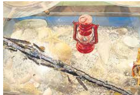
BICHERO Instrumento de metal terminado en un garfio, utilizado para extraer del mar capturas de grandes dimensiones.