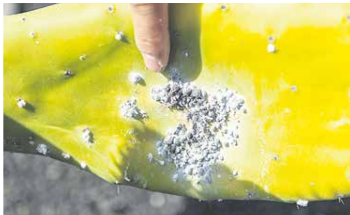
Ejemplo de “cochinilla buena”.

Se trata de una planta muy versátil gracias a su resistencia y ofrece una multitud de aplicaciones en diferentes campos y cada vez más innovadores, como es el caso de un empresario lanzaroteño que ha empezado a producir aceite con las semillas de la fruta de la tunera. “De la semilla del tuno está sacando un aceite muy puro. Está cogiendo la semilla del tuno y está elaborando un aceite. Aceite que se puede utilizar tanto en cosmética como en alimentación. Es muy puro, como el de argán. Está muy bien concentrado”, explica.