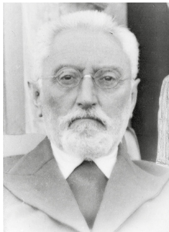
Foto de Unamuno y Soriano en camello. A la derecha, retrato de Unamuno.

con claras vinculaciones con los ideales republicanos e ilustrados en Gran Canaria. El pintor canario hablaba en sus memorias de Lanzarote como “aquella pobre isla entonces tenida en tan poca consideración (...) servía como una especie de penal”.