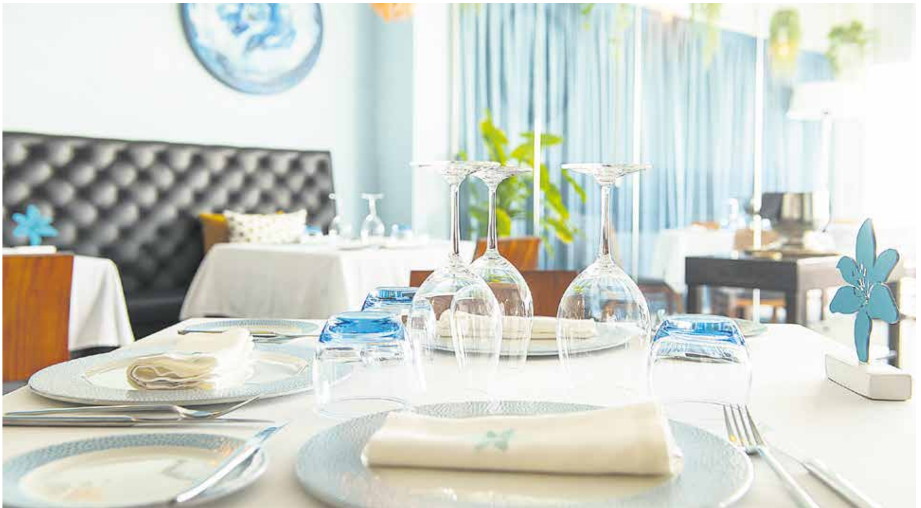
La restauración lanzaroteña busca revalorizar la profesión del personal de sala.