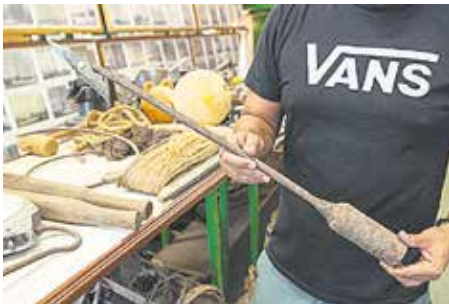
ARPÓN ARTESANAL Herramienta para la captura de delfines para consumo alimentario. Actualmente, en desuso.