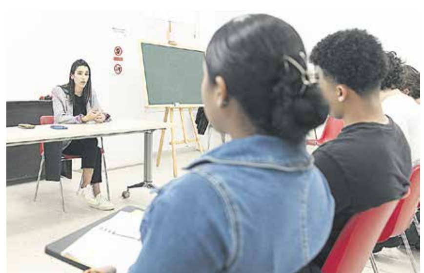
La consejera, durante la entrevista.