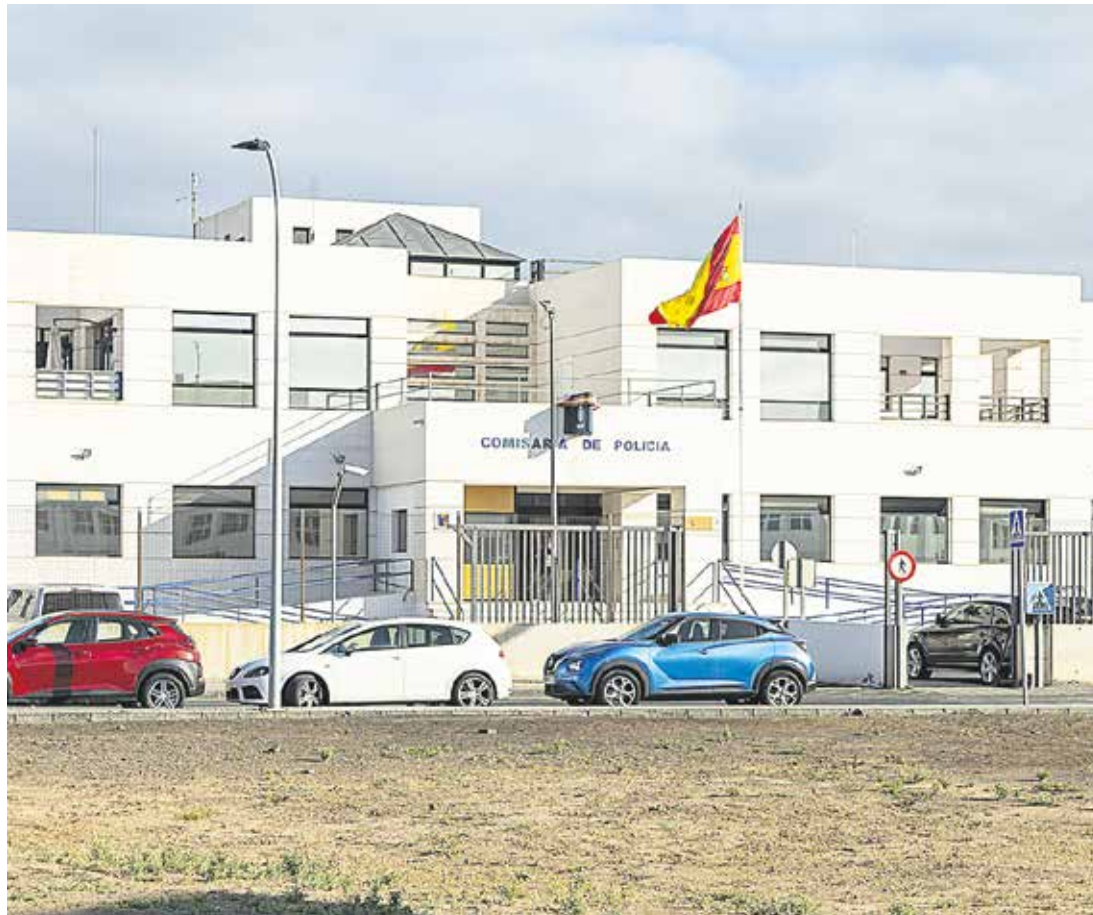
Comisaría de Arrecife.

El 60% de la plantilla en Lanzarote presenta “ansiedad generalizada en relación con las condiciones del trabajo”, según la evaluación de Prevención de Riesgos Laborales