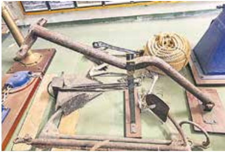
PESCANTE Instrumento con más de cien años de antigüedad destinado a guindar artes pesqueras o cabos.