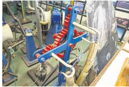
MANIVELA Aparato de tierra para trenzar y fabricar cabos a partir de una sola hebra, con destino al uso en embarcaciones.