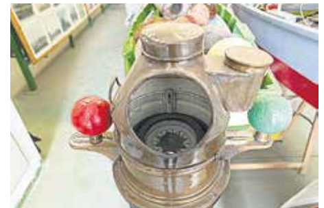
COMPÁS Equivalente náutico de la brújula, procedente de un barco de vela. Década de los 40 del siglo pasado.