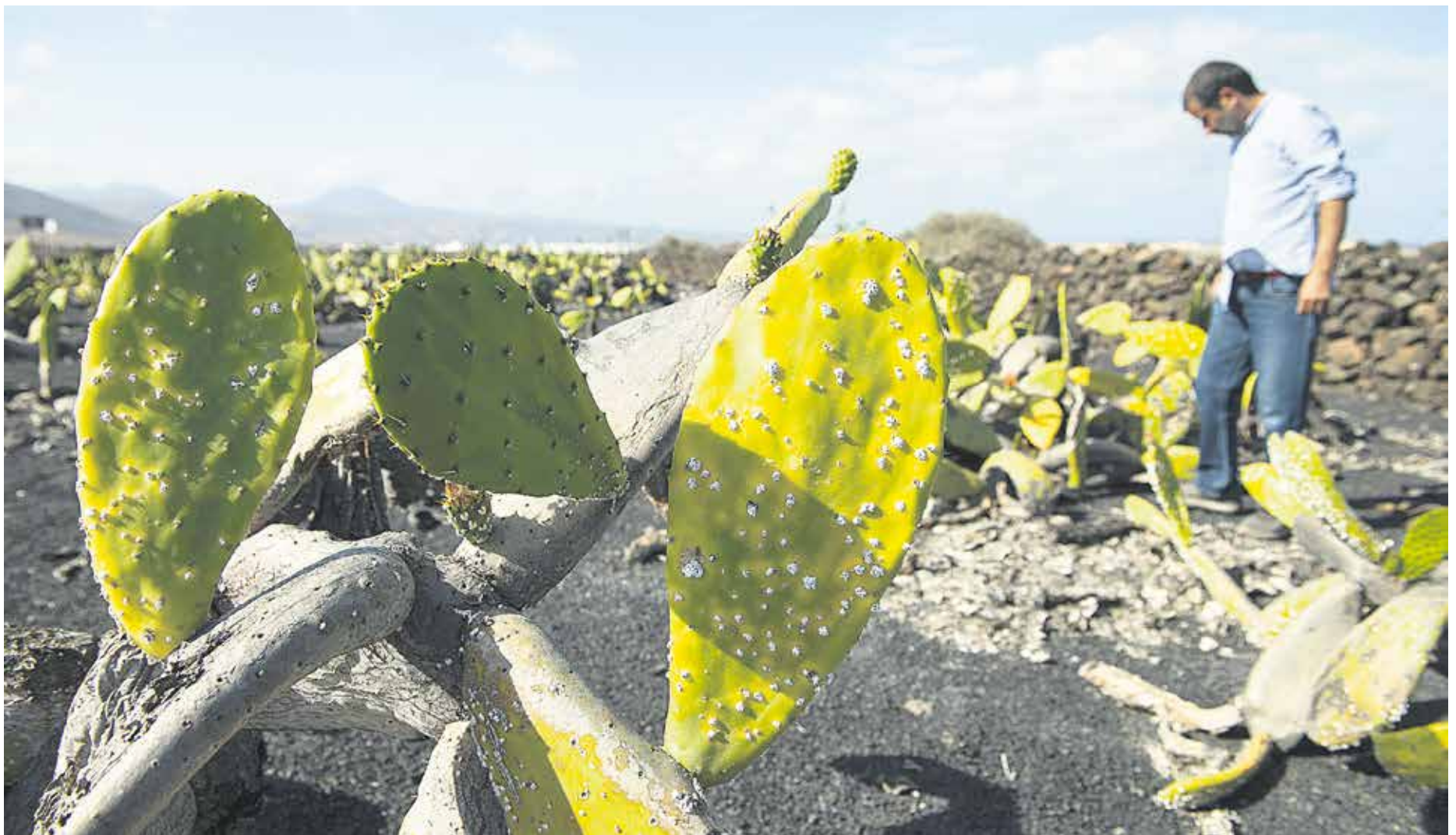
Tunerar en la zona de Guatiza y Mala.