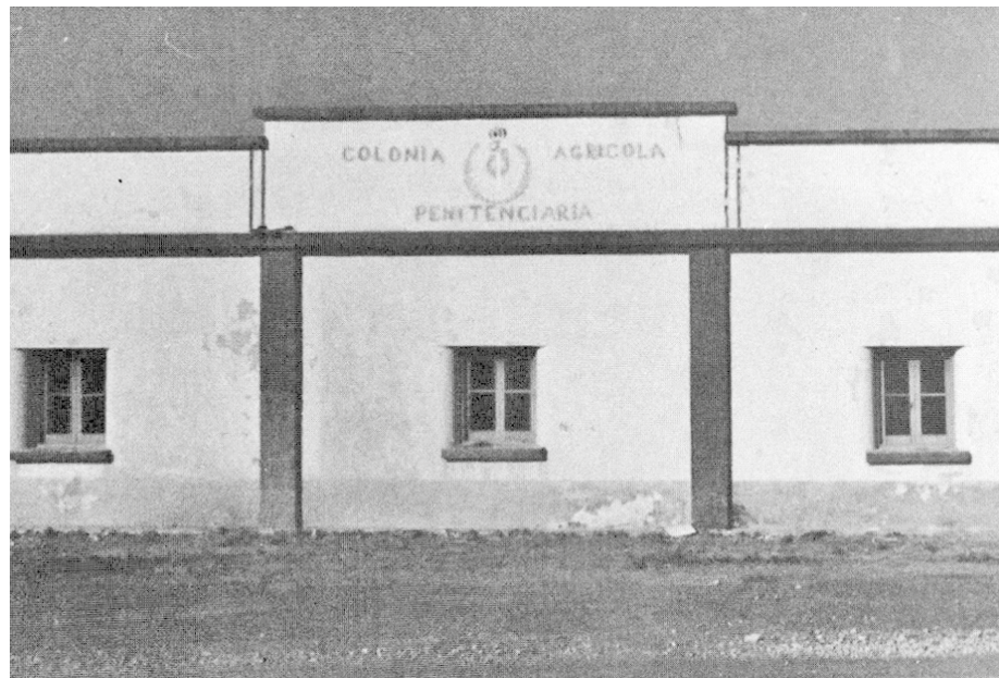
Fotografía de la entrada del Centro Agrícola Penitenciario de Tefía.