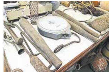
PORRÑO Porra de madera que se utilizaba para matar atunes y otras capturas de grandes dimensiones.