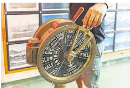
TELÉGRAFO DE PUENTE Dispositivo instalado en el puente de mando por medio del cual se transmiten órdenes y/o información sobre la velocidad o la dirección a seguir.