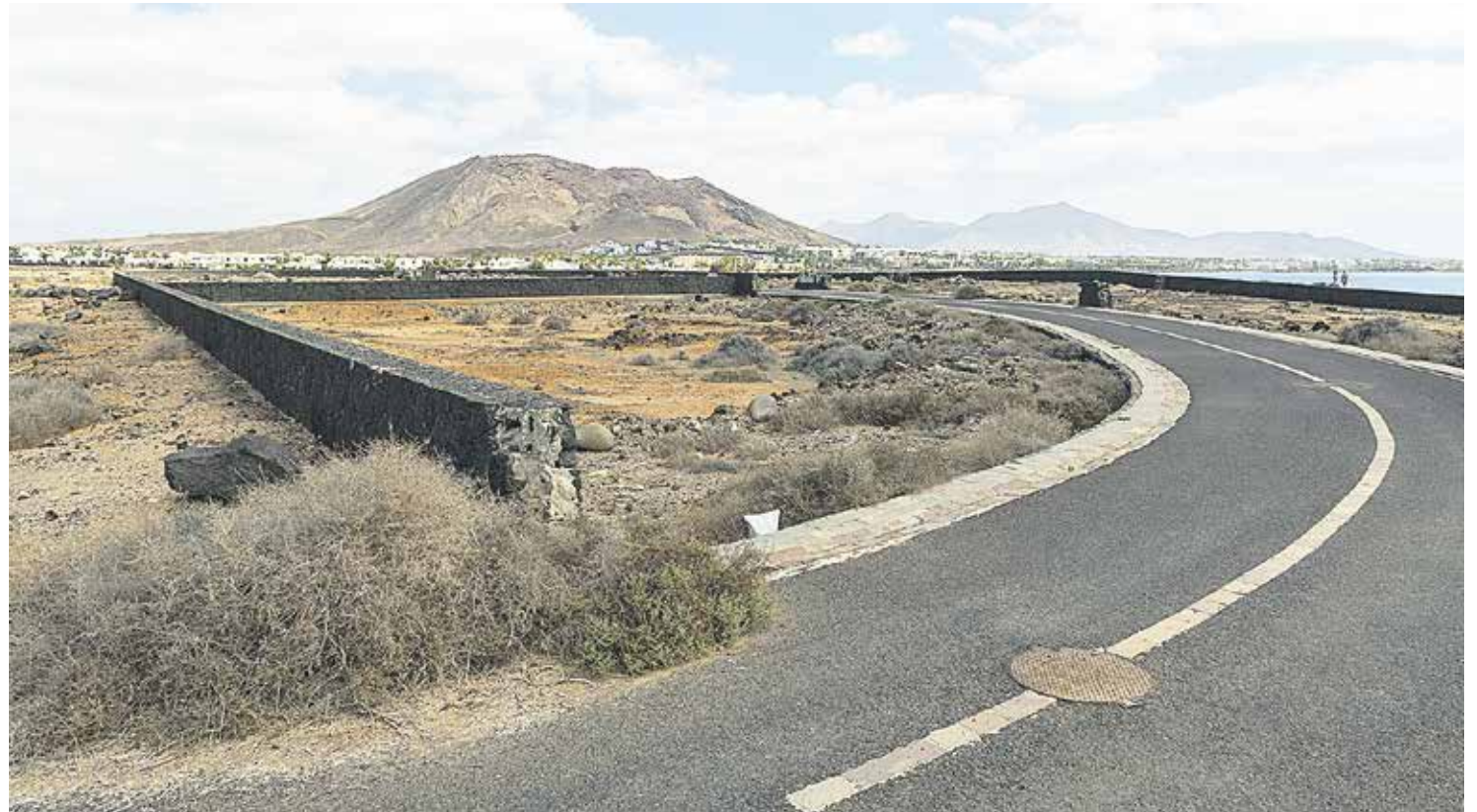
Terrenos de Urena Mountain, en Playa Blanca.

La parcela de Urena Mountain, en Montaña Roja, con licencia anulada, arrastra un procedimiento desde hace 15 años y tiene sentencia favorable