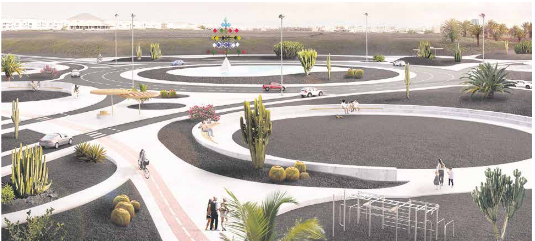
Infografía de la alternativa de PLZ21 al enlace entre la autovía y la circunvalación, con perspectiva del conjunto en la superficie. El tráfico rápido iría soterrado.