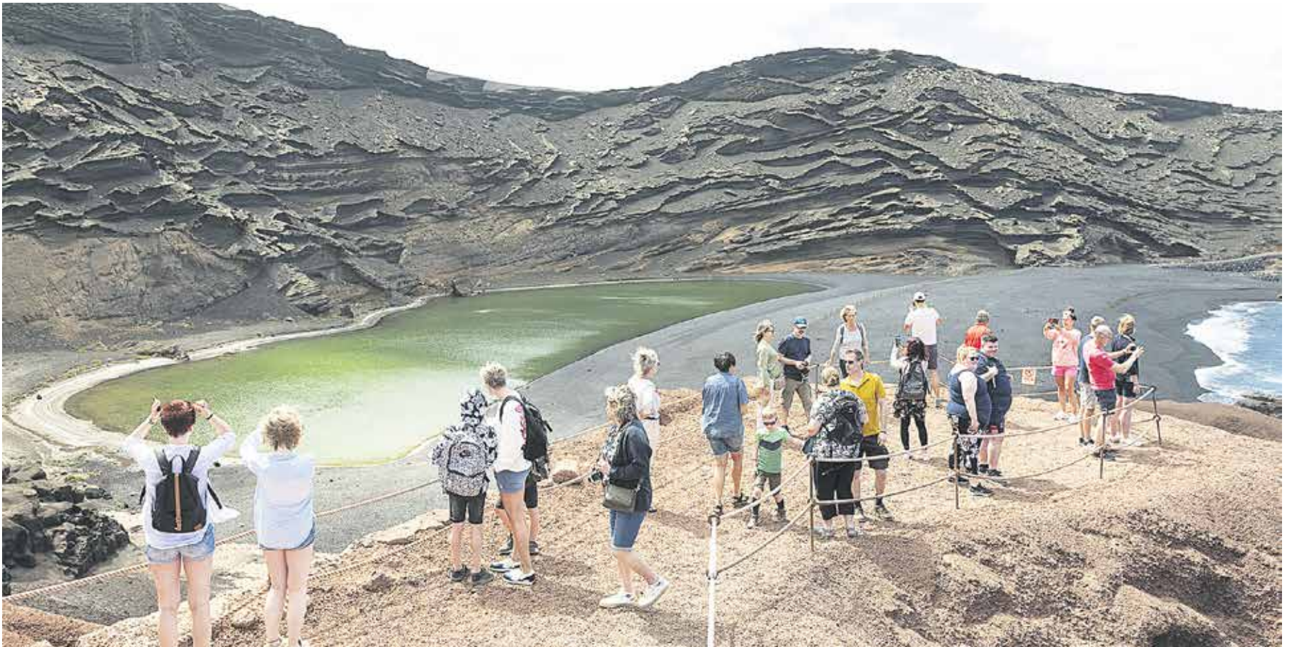
Visitantes en el Charco de los Clicos.