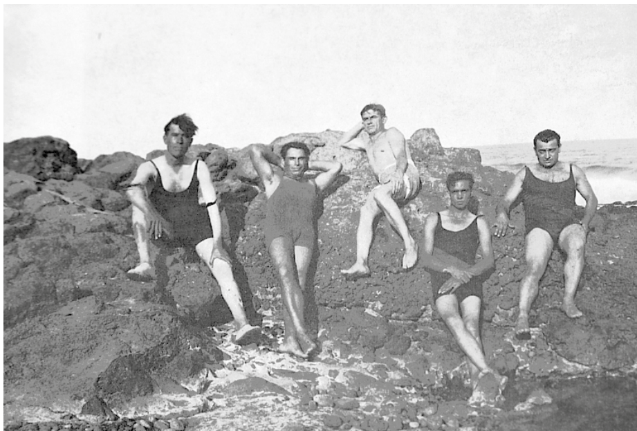
Foto de Durruti y otros anarquistas en Fuerteventura. Imágenes del libro 'Durruti en la revolución española' de Abel Paz.