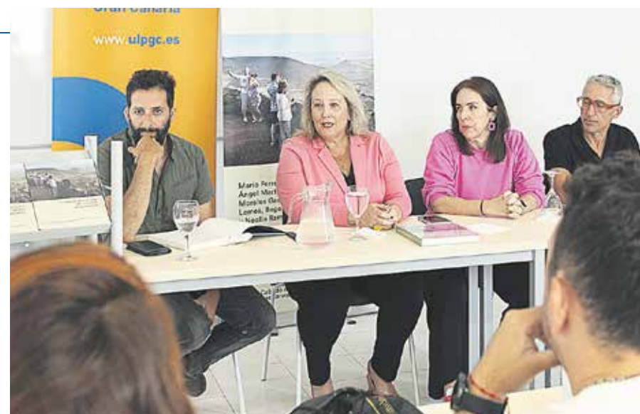
Presentación del libro en la EUTL.