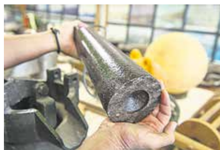
ESCANDALLO Sonda de metal atada a un cabo con una concavidad que se rellenaba de sebo para informar de los materiales del lecho marino, arena, marisco, fango...