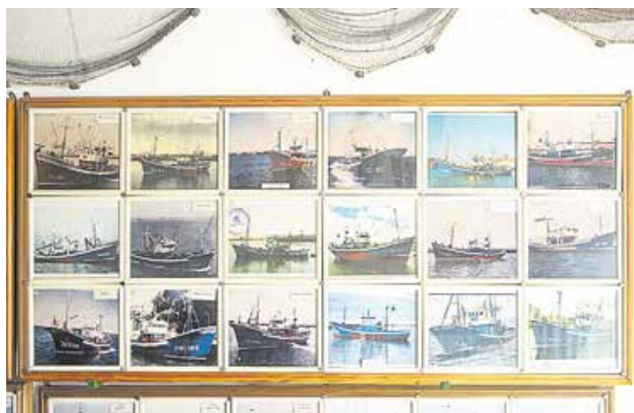
Colección de fotografías de embarcaciones históricas y modernas.