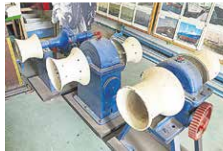
MAQUINILLAS Herramientas para la recogida manual de los cabos, procedentes de atuneros artesanales. Años 80-90.