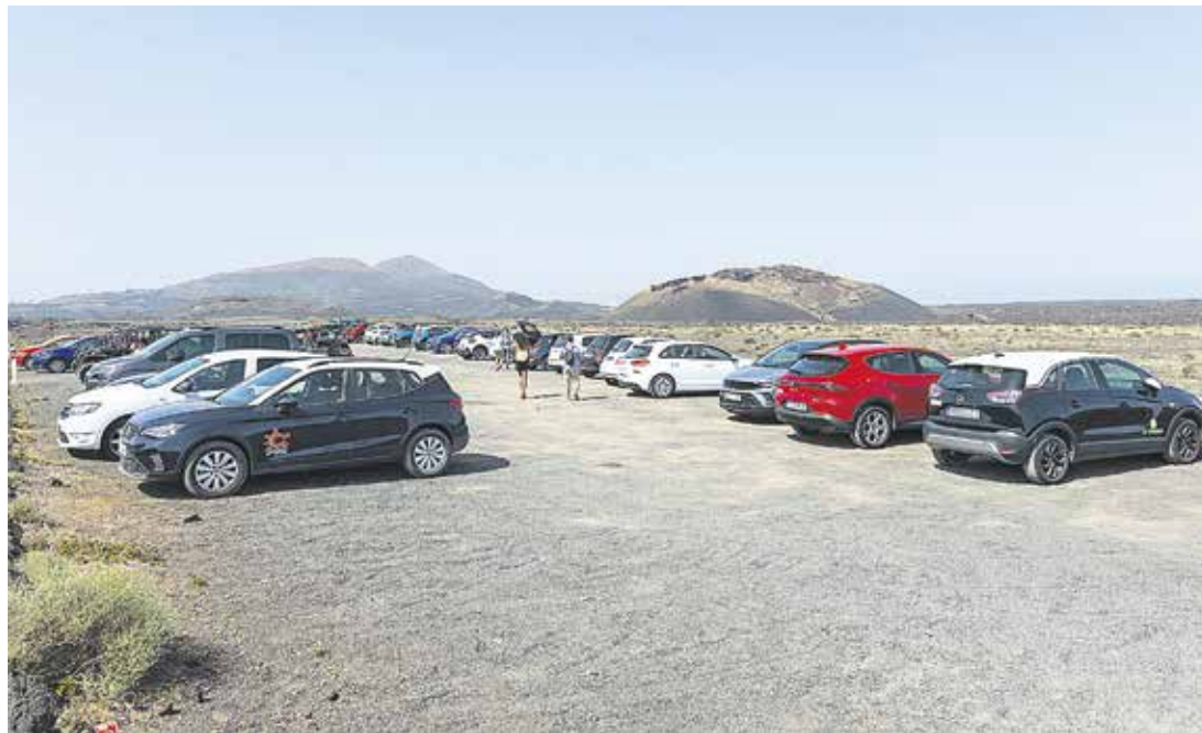
Aparcamiento en el Volcán del Cuervo.

En el Volcán del Cuervo esa percepción de saturación es menor, pero “no deja de ser relevan-