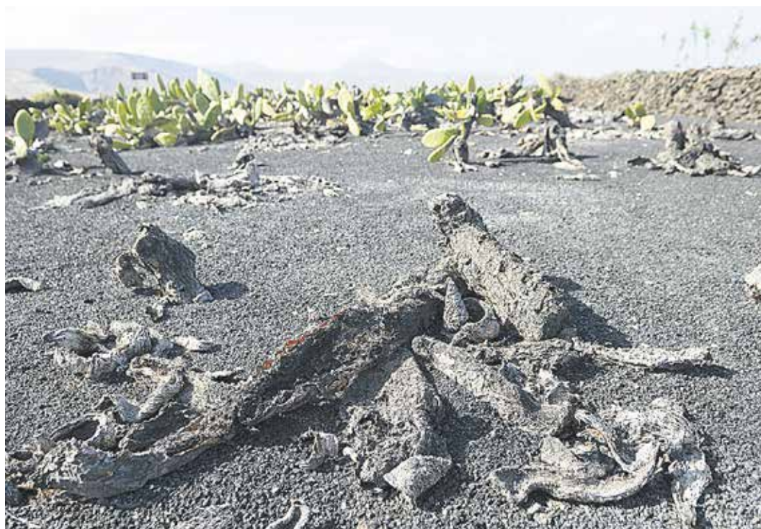
Tuneras afectadas por la plaga.

Se estima que en Lanzarote hay más de 30.000 kilos de cochinilla seca almacenada