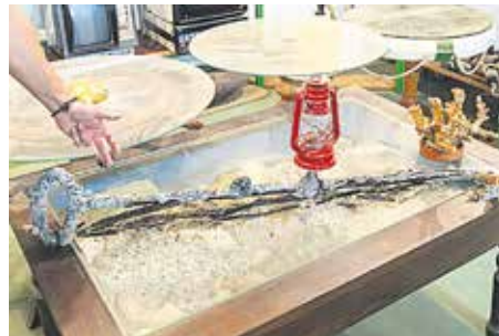
CORAL Y CARACOLAS Muestras de conchas, caracolas, estrellas de mar, corales y otros ejemplos de la biodiversidad de los fondos de Lanzarote.