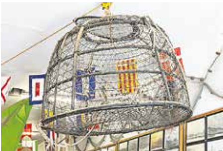
NASA PARA BARCO DE VELA Arte de pesca original de mitad del siglo XX con boca inferior. Se usó también en los primeros barcos a motor. En desuso.