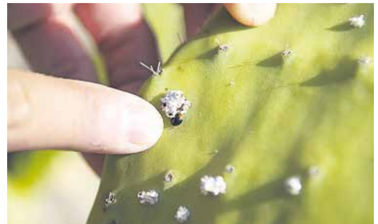
Ejemplo de “cochinilla mala”.