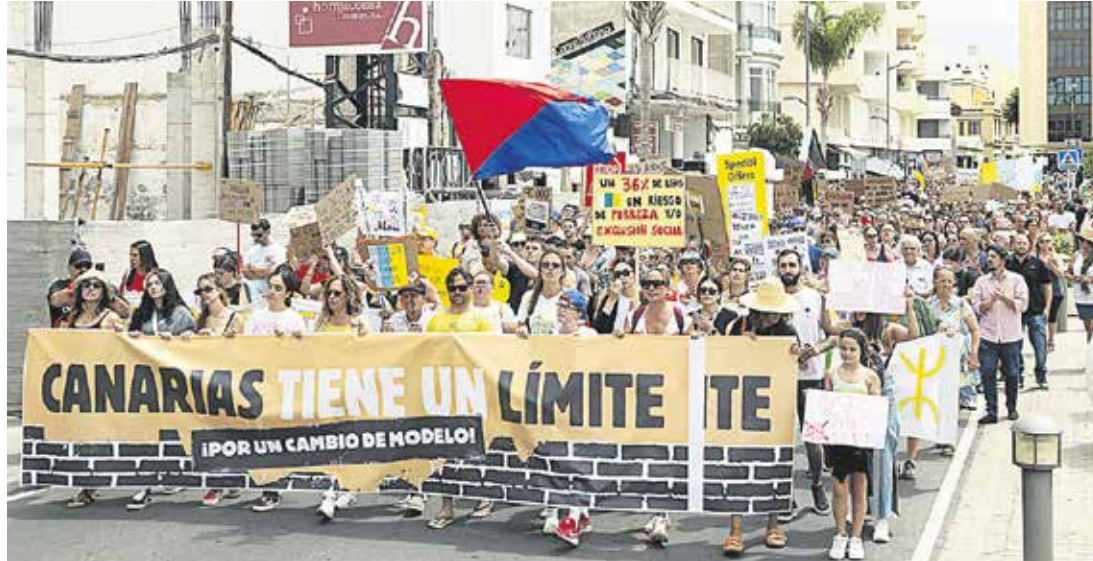
La cabeza de la manifestación del 20 de abril.

Los manifestantes dejaron cientos de mensajes con sus pancartas y sus reivindicaciones que ya han generado contestación pero no una reacción política clara