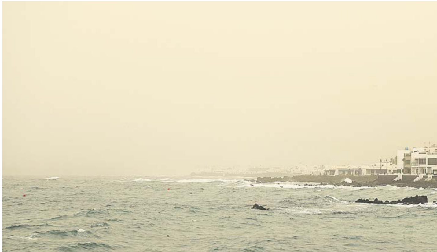
Calima intensa en Punta Mujeres.