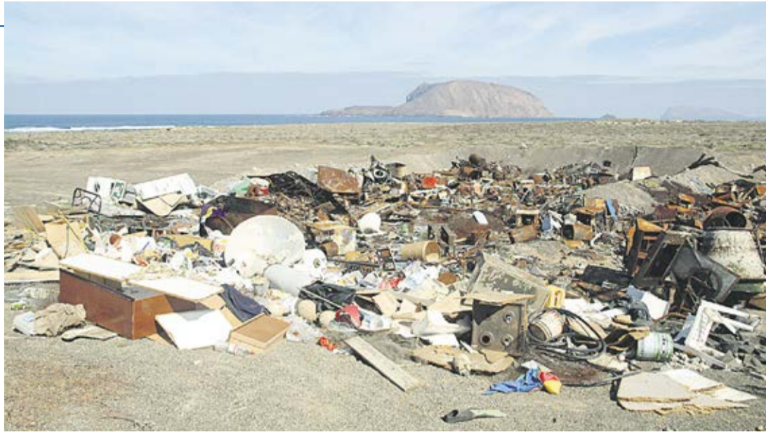
Zona de acumulación de residuos en La Graciosa.

La Graciosa tiene una planta de transferencia de residuos que resulta insuficiente. Todos los residuos se compactan y posteriormente se trasladan al Complejo Ambiental de Zonzamas. No existe punto limpio. El Ayuntamiento organiza, dos veces al mes, recogidas puerta a puerta de enseres para su posterior traslado. Los residuos procedentes de demolición y construcción se amontonan en la calle durante las obras y después se trasladan a Lanzarote, pero ese traslado está condicionado por la falta de medios, así como por la elevada producción de residuos y el escaso nivel de separación en origen. “El actual sistema de gestión no es acorde a la población actual y la actividad turística que se desarrolla en la isla”. Las instalaciones y la gestión son insuficientes. La comunidad energética ha sopesado la posibilidad de introducir una pequeña planta de valoración de fracción orgánica y espera que se haga un análisis detallado de la posible ampliación de la planta, así como la tecnología que minimice los impac-