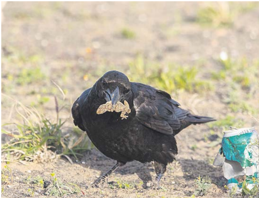
Un cuervo se alimenta de un reptil extraído de una lata.