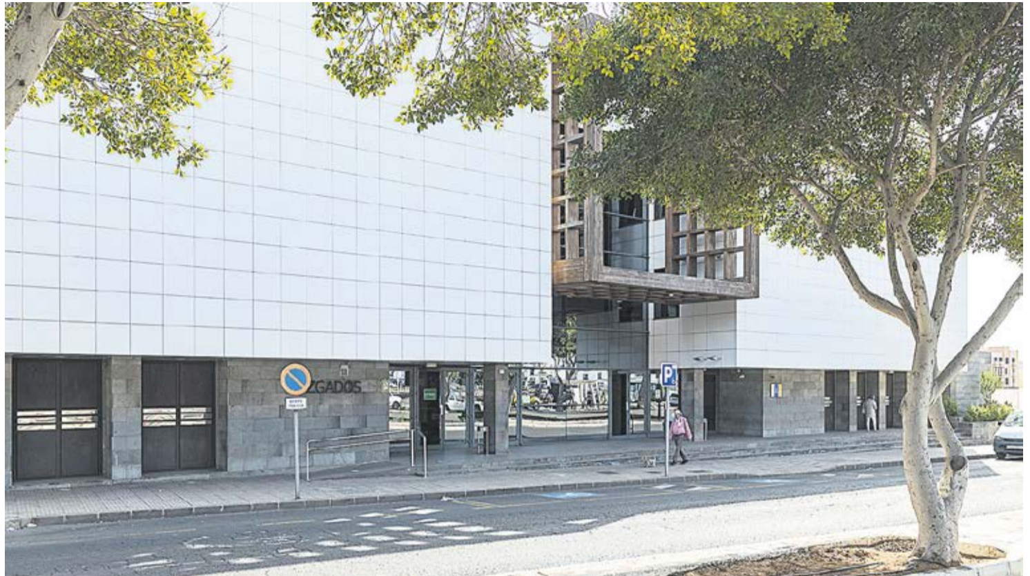
Juzgados de Arrecife.

La mercantil se había constituido en el año 2000. Según la