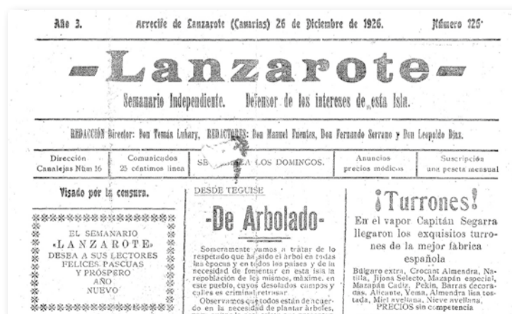
Portada del periódico Lanzarote de 1926 dedicado al tema del arbolado.

Además de reflejar la trágica realidad de las sequías y de reclamar insistentemente ayuda