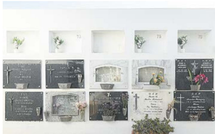
Nichos donde están enterrados los marineros.

hasta descubrir que los cuerpos de los marineros fallecidos no se encontraban desaparecidos en el mar como se pensaba durante medio siglo, sino enterrados en el cementerio lanzaroteño. Las dificultades de la época para identificar los cadáveres hallados impidió conocer la identidad de cada uno de ellos, por lo que las autoridades locales procedieron al sepelio de los restos en nichos con números, sin que pudieran constar nombre y apellido de los tripulantes.