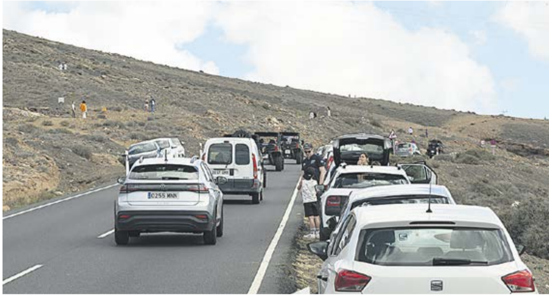
Coches aparcados en Las Grietas.

ellos ocupan plazas en las urgencias o en los quirófanos. Tan solo en una ocasión, en 2017, se hizo público el gasto destinado en el Área de Salud de Lanzarote a la atención a terceros. Eran nueve millones, que pagan los turistas o sus seguros médicos, y que no vuelven ni a la sanidad lanzaroteña ni a la Isla. Se pagan al Estado y este a su vez al Gobierno canario, pero no tienen carácter finalista. Canarias destina 1.515 euros por habitante en gasto sanitario al año. Es la sexta comunidad que menos dinero dedica. Los turistas, ni salen en la estadística ni computan para las necesidades de inversión.