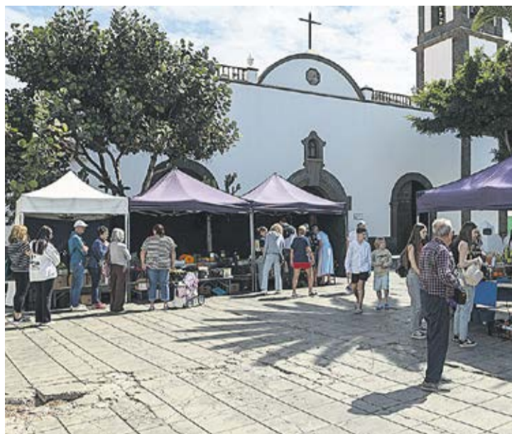
Puestos en el mercadillo en la Plaza de Las Palmas.

Finalmente, Naredo señala que en el mercado inmobiliario, los precios están orquestados. “Ha quedado claro, yo sigo los datos desde hace muchísimos años y los anuncios de pisos ya bajaban antes de que lo hicieran los precios de tasación, mientras que ahora suben antes las tasaciones que los precios, porque está orquestado y las tasadoras pertenecen a las instituciones financieras”.