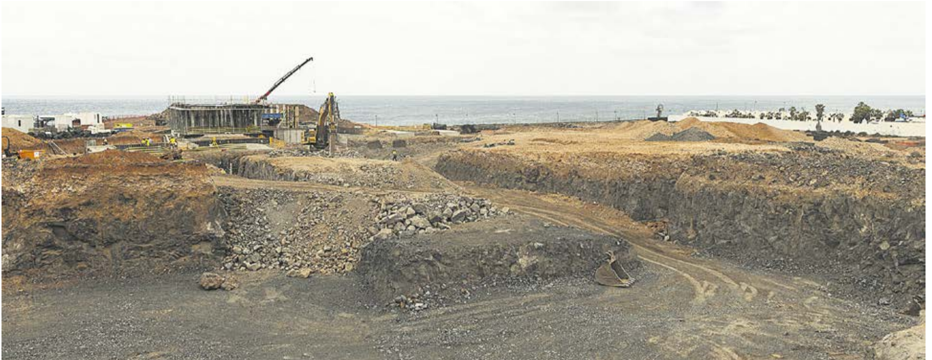
Terrenos donde se construye el hotel.