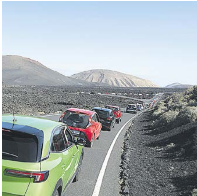
Colas en Timanfaya.