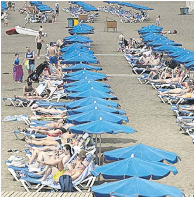
Turistas en Playa Grande.