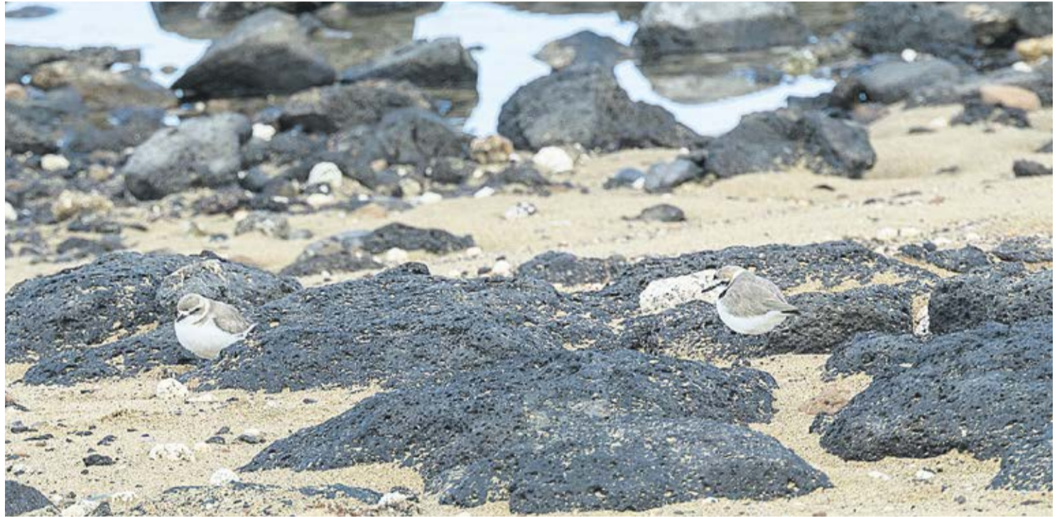
Chorlitejo en Arrecife.

Esta ave pequeña y peculiar se encuentra en Lanzarote, La Graciosa y Fuerteventura, y entre sus principales amenazas destaca la creciente presión humana