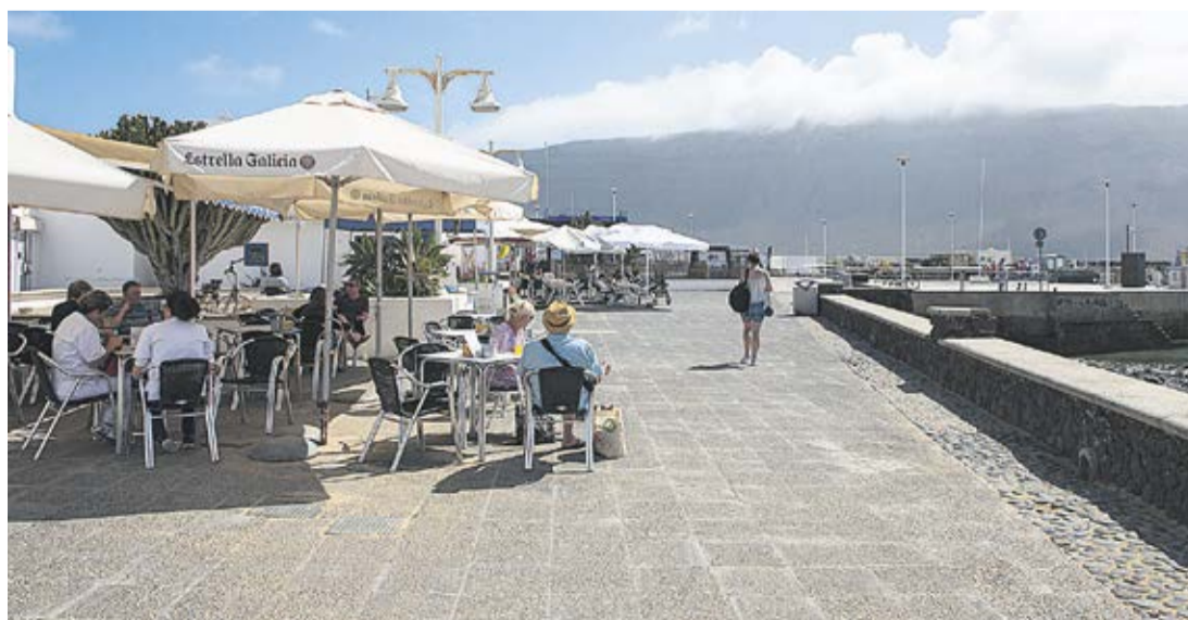
Una terraza en Caleta del Sebo.

Tiene 700 habitantes censados y medio millón de visitantes al año