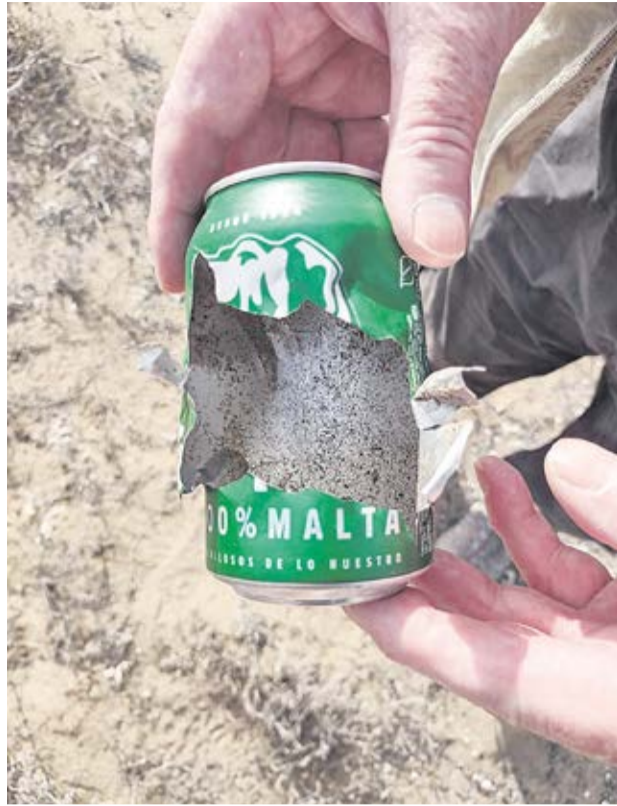
Así acaba una lata picoteada por un cuervo.