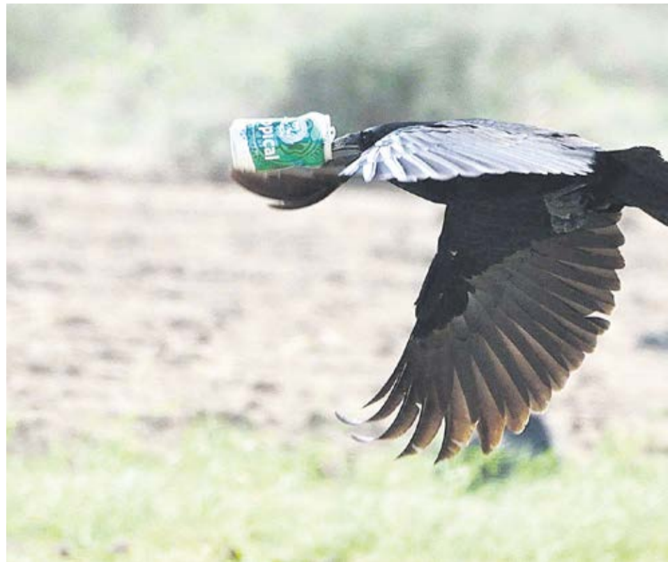
El ave sale volando con la lata de cerveza.