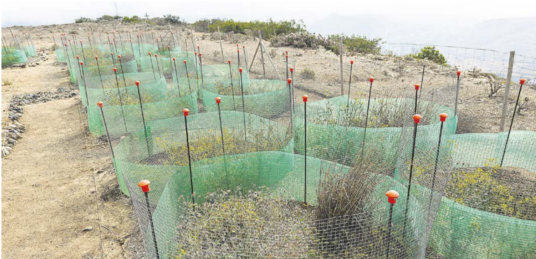
Parcela en el Risco de Famara utilizada para la repoblación experimental de la zona.