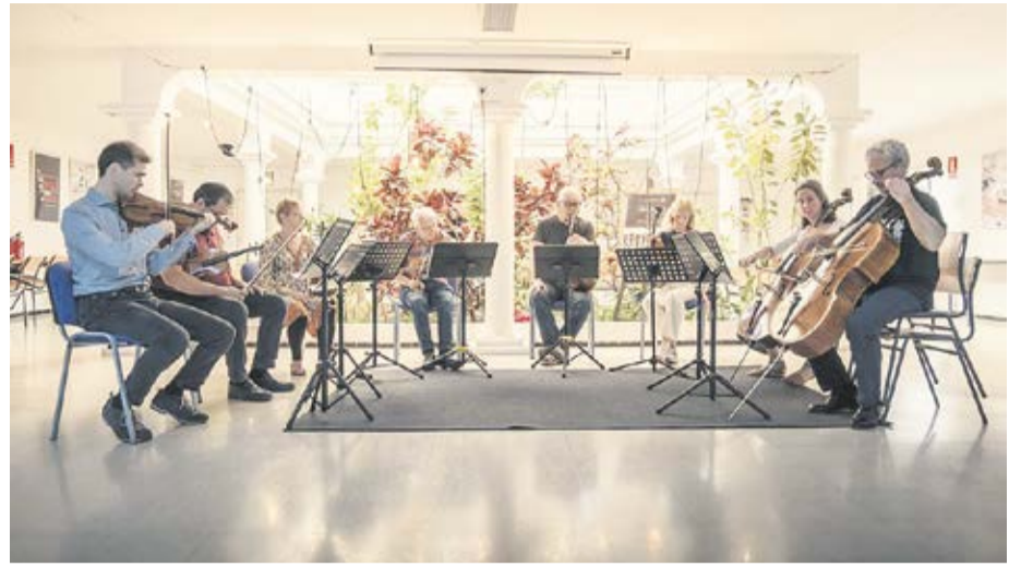
Minipodcast y uno de los conciertos de 10 minutos.