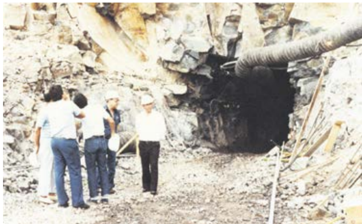
Foto de la construcción de una galería en el Risco de Famara en 1982, con varios técnicos y políticos del Cabildo de Lanzarote. La explotación de las aguas subterráneas fue otra reclamación habitual de la prensa histórica de ambas islas.

En determinadas ocasiones, la búsqueda de remedios llevaba a apostar por soluciones escasamente creíbles, como hizo Lanzarote (1924-1928, Arrecife), que apoyó insistentemen-