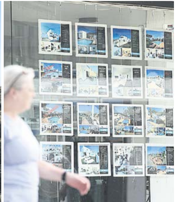
Anuncios en una inmobiliaria.