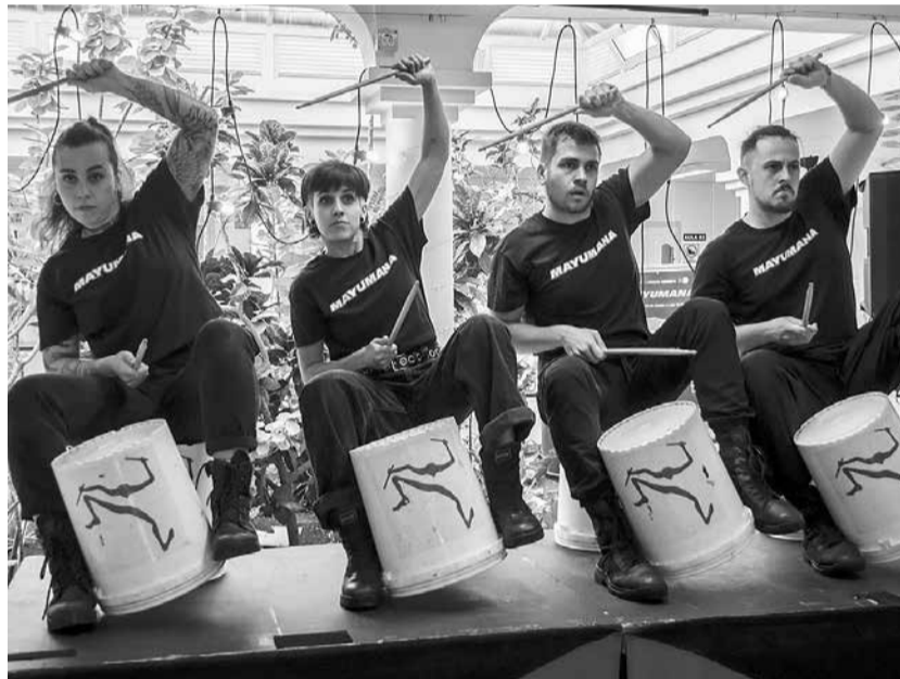
Actuación de Mayumaná.

Los minipodcast del mes de marzo están dedicados a la mujer, pero cada mes las activida-