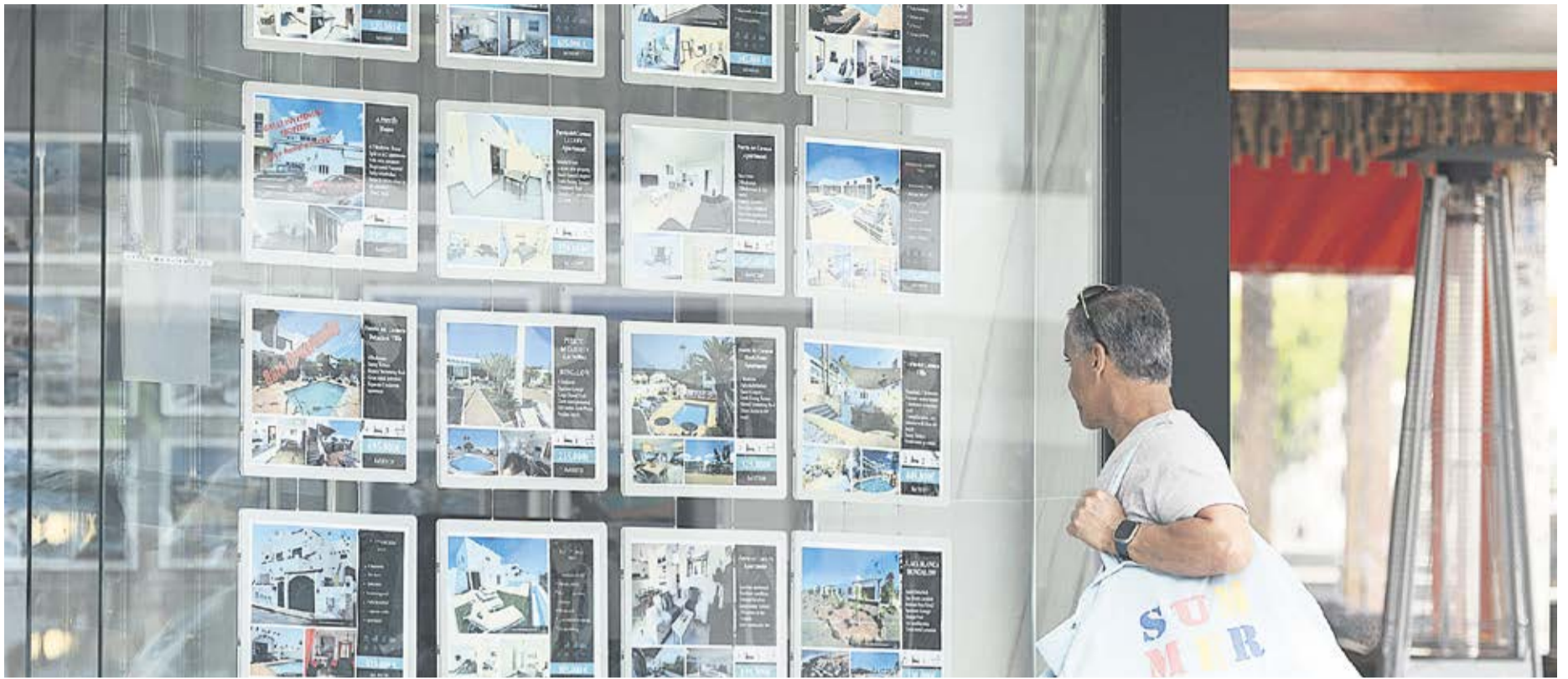
Un señor observa los precios de la vivienda de una inmobiliaria. Foto: Adriél Perdomo.