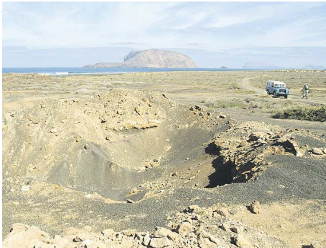
Un jeep por un sendero de La Graciosa.

Esos saltos comienzan en 1943 con la construcción de tres aljibes en Caleta del Sebo y uno en Pedro Barba y la adquisición por parte de la iniciativa pública de otro más que ya estaba construido para el ganado. “No había luz y se desconoce cuándo se empezaron a hacer pozos negros. Los escombros y basuras se tiraban en varios puntos de la isla. La energía principal era la quema de matos y el viento. En esos momentos la desertización de la isla era total”, señalan.