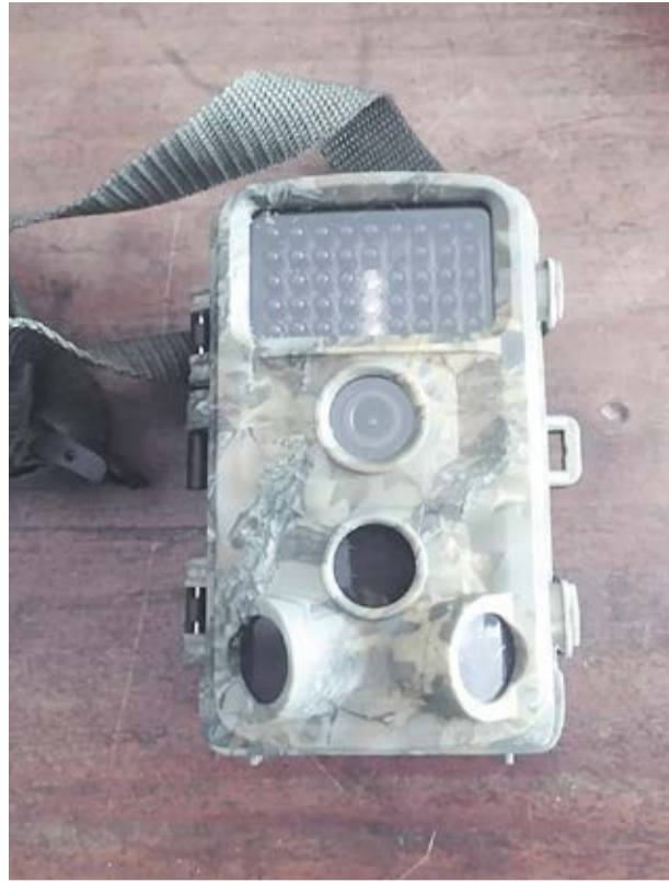
Cámara de vídeo usada durante la investigación.

bre las motivaciones específicas detrás de este comportamiento y cualquier evidencia de uso de herramientas. Además, este estudio ha resaltado una disparidad en el tipo y la cantidad de datos recopilados a través de la tecnología de trampas de cámara en comparación con las observaciones manuales humanas, proporcionando información sobre estrategias metodológicas óptimas para estudios futuros”, concluye.