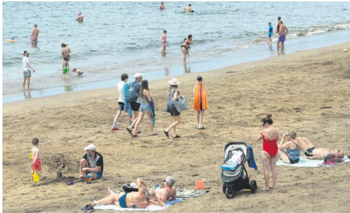
Turistas en Puerto del Carmen.

¿Por qué afirmo que la contradicción gobierna nuestra realidad? Porque la situación económica de los mercados emisores dista mucho de ser óptima. Alemania cerró el año 2023 con una recesión leve, pero recesión, al fin y al cabo: una merma de un 0,3 por ciento en su Producto Interior Bruto, un dato que en el mundo prepandémico habría provocado restricciones en el gasto prescindible de las familias germanas. Lo mismo puede decirse sobre el Reino Unido, sometido al dato autoinfligido por el disparatado Brexit. La economía británica cerró el año pasado con un crecimiento mínimo, de un 0,1 por ciento, pero con un retroceso de un 0,4 por ciento en el segundo semestre. Y las perspectivas, en el caso de ambos gigantes de la economía continental, no resultan halagüeñas, por motivos diferentes, sea el caos político o el declive industrial; eso, por no hablar de los tambores de guerra y el realineamiento de las prioridades geopolíticas. Ninguna de estas circunstancias ha impedido que la demanda de servicios turísticos se haya mantenido fuerte en unos tiempos, los raros años veinte, más asociados con el disfrute efímero que con la acumulación de bienes. La pandemia ha refor-