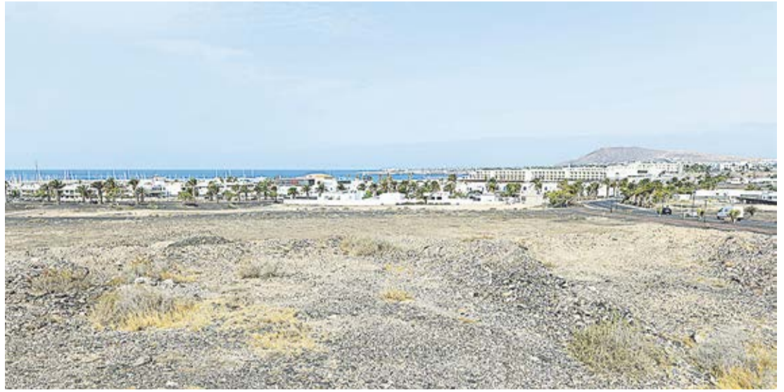
Parcela donde se asentaría el nuevo hotel de Playa Blanca.

El nuevo establecimiento se construirá en la misma calle que el macro hotel de 1.440 plazas recién inaugurado