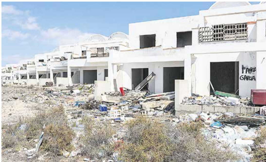
La parte superior de la urbanización está llena de escombros.

“Cada día es todo más costoso y los propietarios abusan”, dicen los vecinos