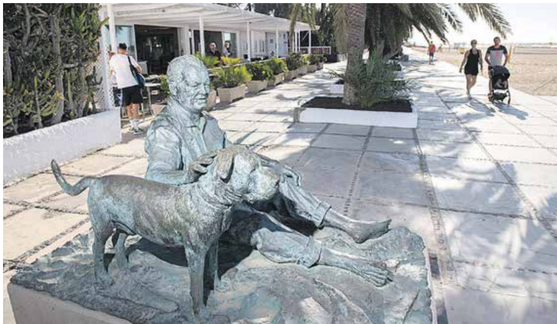
Escultura dedicada a Willy Brandt en Jandía, que se inauguró en 2017.

sita, se estrenó una escultura en honor a Willy Brandt en el paseo de Jandía.