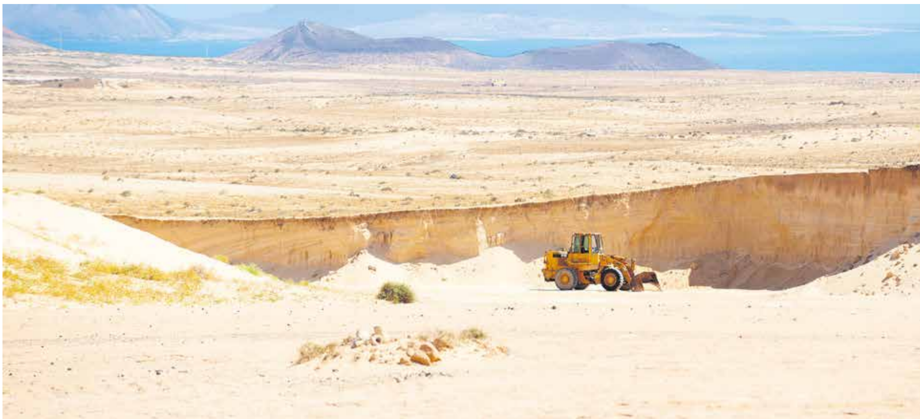
Extracciones en El Jable.