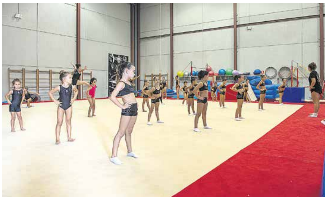
El Club Isla de Lanzarote trabaja con la base.