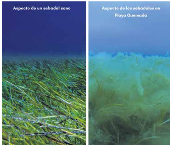
Imágenes comparativas del estudio de sebadales de Yaiza.

“El pre-estudio que se presenta en este documento ha de servir como documento de conclusiones preliminares de cara a un estudio completo y de una estacionalidad al menos de un año. Al tratarse de un pre-estudio de impacto ambiental, las con-