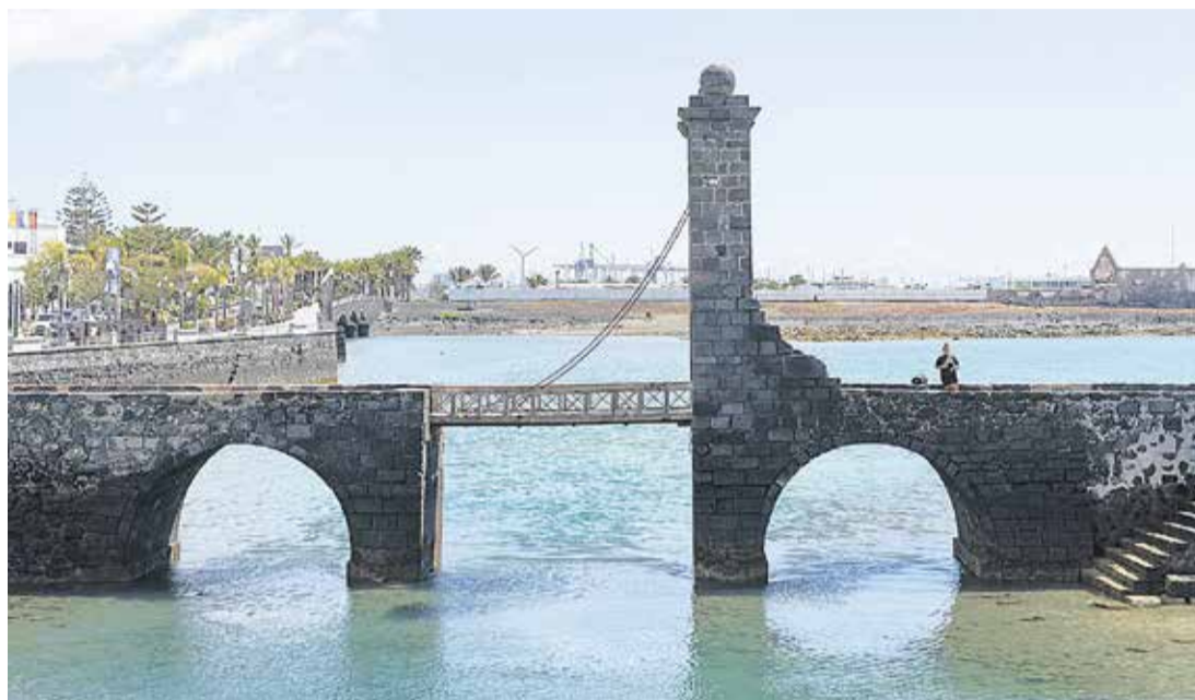
Puente de Las Bolas.

En 2000 fue el primer intento para declararla Sitio de Interés Científico y ahora se encarga otro estudio para determinar si la competencia es del Estado o de Canarias