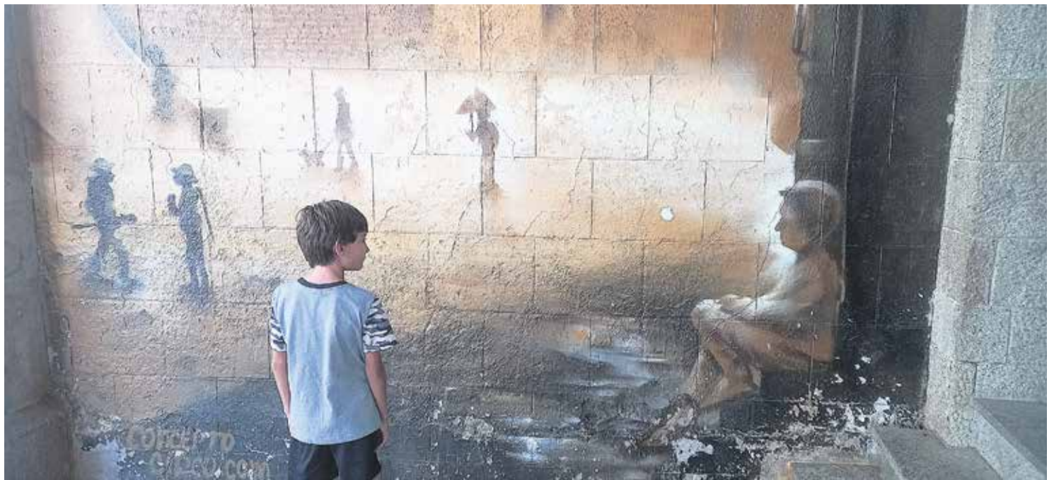
Mural de Concepto Circo en un portal de Lugo.

Antonio tiene un pequeño puesto bajo un árbol en el mer-