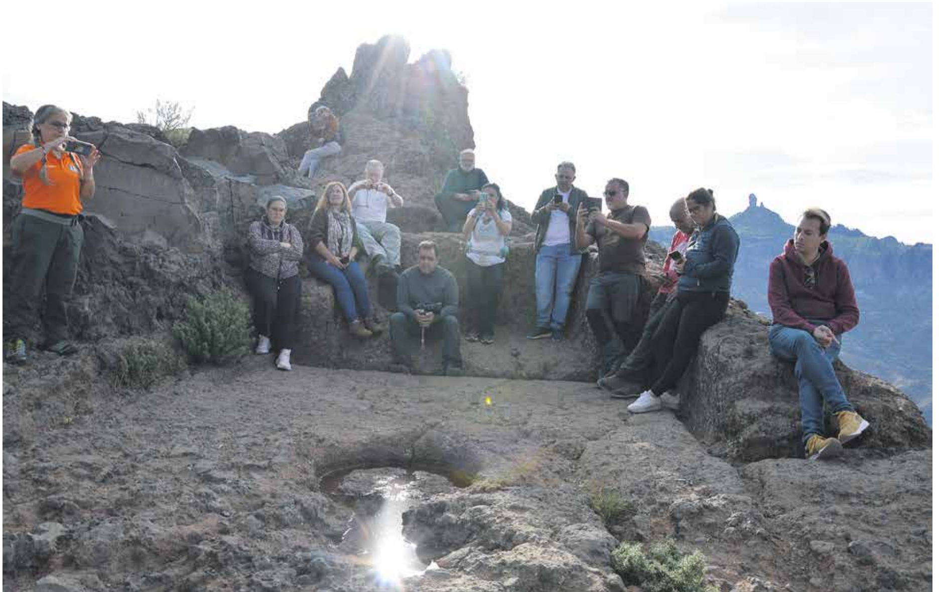
El sol incide en el lugar de culto aborigen del Bentayga.