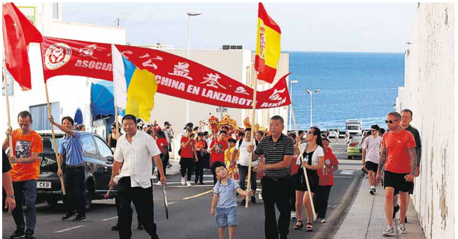
Pasacalles del primer festival cultural chino en Puerto del Carmen.

Se trata de una ONG china pero sus integrantes aclaran que no solo es para esta comunidad en Lanzarote, sino para todo el mundo. No solo prove-