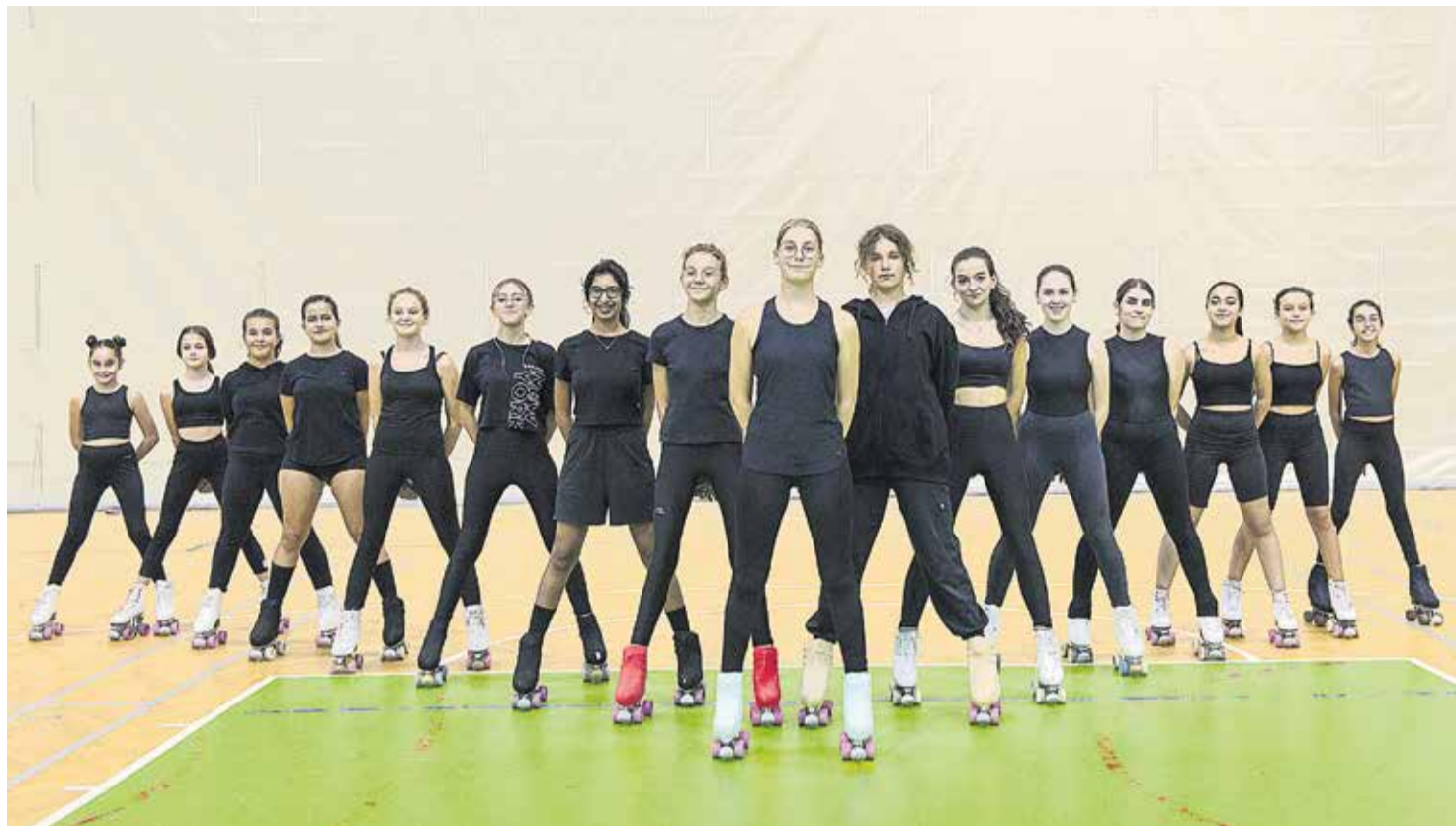
La Asociación de Patinaje lleva más de 20 años formando a patinadores.

El club tiene su sede en Tegüise. Desde la inauguración del techo del pabellón municipal en 2008, la Asociación entrena allí a diario y es donde generalmente realiza sus espectáculos. “Somos un club y una escuela amateur , no tenemos patrocinador que nos ayude económicamente. Por suerte a lo largo de los años hemos adquirido diferentes recursos que nos permiten funcionar sin necesidad de que las familias paguen el vestuario. En el pabellón tenemos un almacén donde