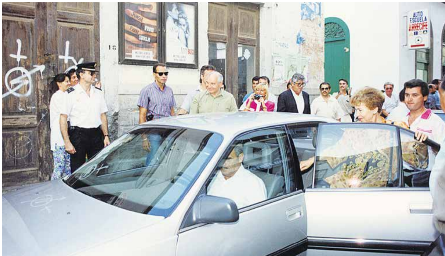
Mijail Gorbachov y Rania en una imagen tomada en Arrecife.

Combinar turismo y destierro puede parecer una anomalía histórica extraña, pero prácticamente coincidió en Fuerteventura, porque los acusados del famoso capítulo del contubernio de Berlín fueron enviados a esta isla en 1962, cuando la industria del viaje ya había echado raíces en Canarias. La tenebrosa Colonia Agrícola de Tefía, un centro penitenciario de trabajos forzados destinado a vagos y maleantes (presos comunes, presos políticos, homosexuales) que algunos han llegado a comparar con un campo de concentración por sus duras condiciones, cerró sus puertas en 1966, justo cuando las abría el Hotel Fariones de Lanzarote, el primer centro de hospedaje moderno de la Isla,