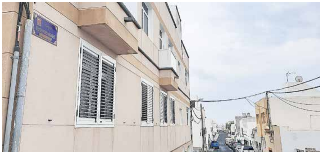
Calle Telesforo Bravo.

El expárroco Antonio Quintana publicó en 2018 un libro que aborda con rigor enciclopédico la historia de este barrio de inmigrantes, que cada octubre celebra su fiesta