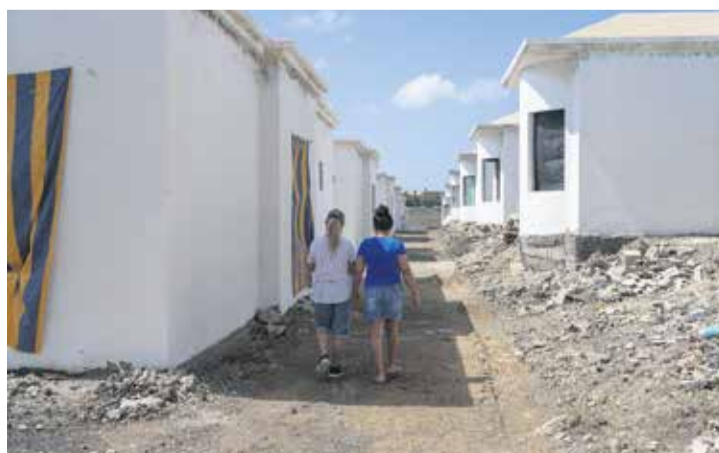
Casas de la urbanización Club del Rey.