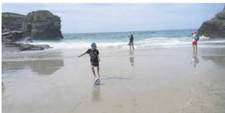
Playa de las Catedrales, este verano mientras sube la marea.

de Arousa. En Vigo es día festivo y los cocederos de marisco devuelven una imagen similar a la de una feria sin gente y con las atracciones paradas. Lo que no cesan son los viajes de ida y vuelta para contemplar las Islas Cíes, en el Parque Nacional de