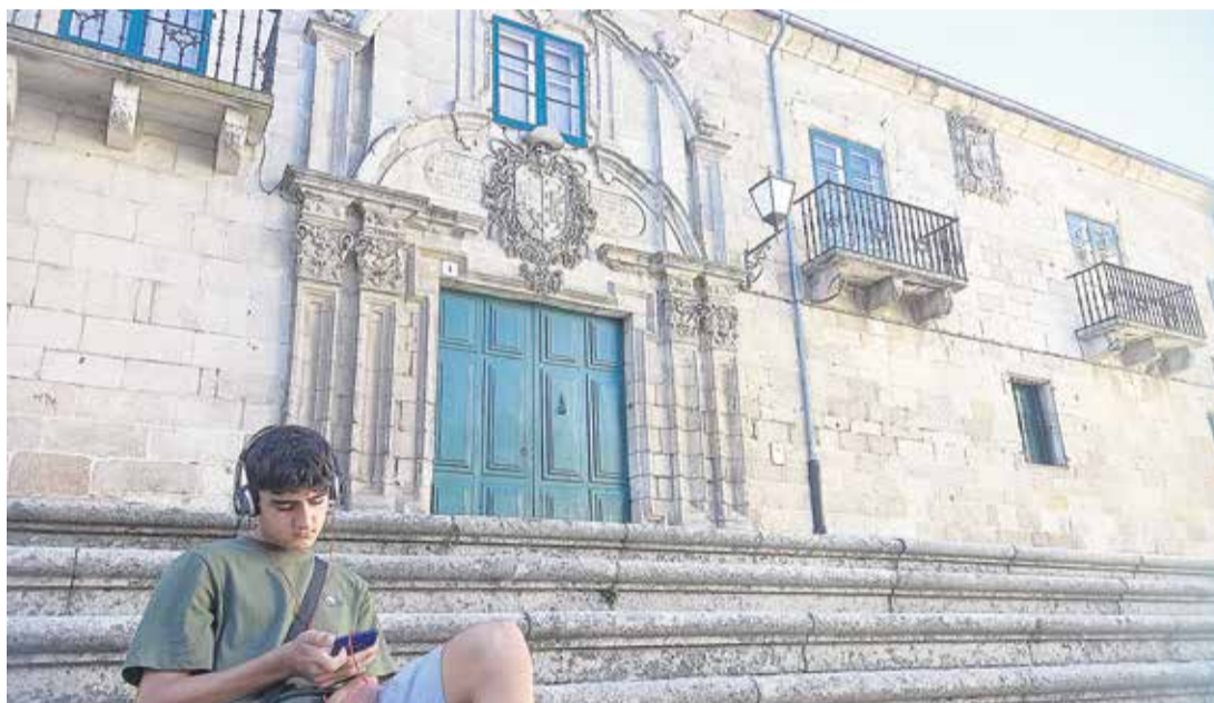
Un muchacho escucha música en el casco histórico de Lugo.

Los fuertes vínculos entre estas dos zonas empezaron a enhebrarse en tiempos de la conquista y se consolidaron desde el siglo XVI