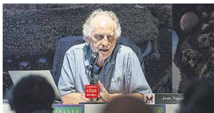
El geógrafo Joan Nogué.

Finalmente, Nogué apuntó hacia la educación: la formal y la informal. “Educar la mirada es fundamental porque la concienciación ciudadana es el primer paso para una ética colectiva y la ética colectiva, a su vez, favorece los valores individuales”. Nogué señaló la mayor satisfacción durante sus doce años al frente del Observatorio del paisaje de Cataluña: haber logrado crear ese clima ético colectivo en algunos ámbitos. Lograr la “conversión” de algún alcalde o de gente que hasta entonces no había disfrutado de su paisaje y ahora lo ama y, por tanto, lo protege. Y, ¿cómo conseguir un clima ético colectivo? A través de la acción, con estrategias de actuación desde la sociedad civil. En el paisaje, la ética y la estética deben ir de la mano. Un paisaje precioso no es completo si sus acuíferos están contaminados. Y por último: “Si se destruye un paisaje se destruye la identidad de un lugar”.