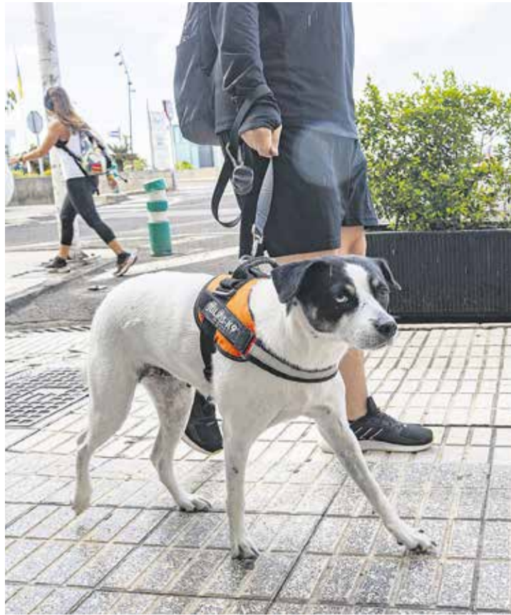
Los propietarios de mascotas se han sentido en cierta manera “abandonados”.

Hay veterinarios que relatan situaciones tensas a las que se han tenido que enfrentar al trabajar de noche: desde la mencionada dificultad para cobrar por el servicio, a propietarios de animales “muy nerviosos” o que molestan a los vecinos de