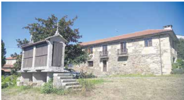
Hórreo y casa rural junto al Pazo Bendoiro.

Como peces de ventosa en un acuario, decenas de personas se agolpan tras las cristaleras que asoman a la venta de pescado en la lonja de O Grove, en la Ría