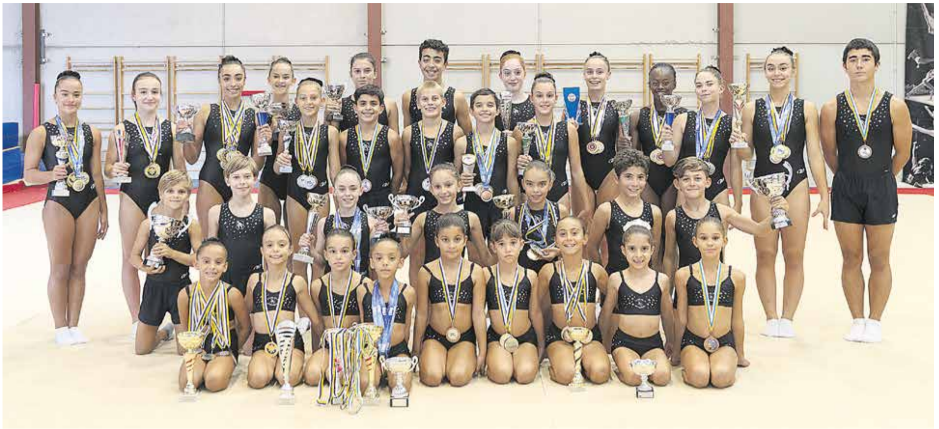
Alumnas del club que dirige Clary Ramos.