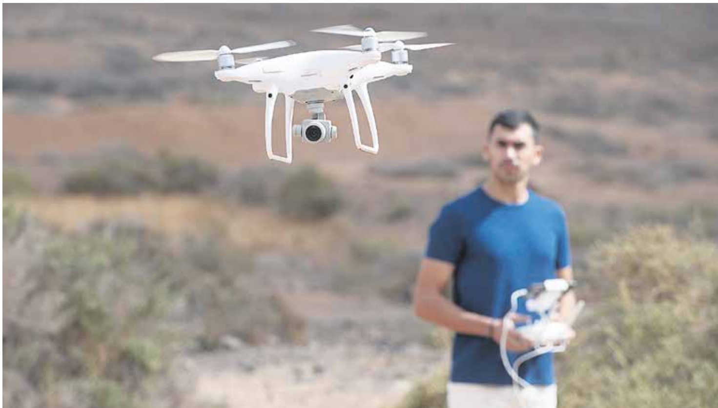
Los cursos de pilotaje de drones se encuentran entre los más codiciados del mercado formativo.

Ya los hay para transportar medicamentos e incluso personas. Los dron-taxi permiten el desplazamiento de hasta dos personas y equipos de forma no tripulada y el primero de España lo ha adquirido la Policía Nacional en Madrid, a la espera de contar con la autorización de AESA para su vuelo. Como vie-