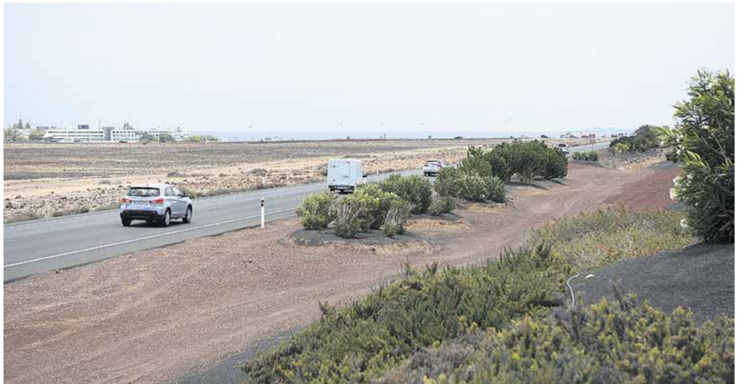
Carretera LZ-2, de Yaiza a Playa Blanca.

El Ayuntamiento de Yaiza ya ha anunciado que va a presentar recurso de casación y también pide al Gobierno que recurra, ya