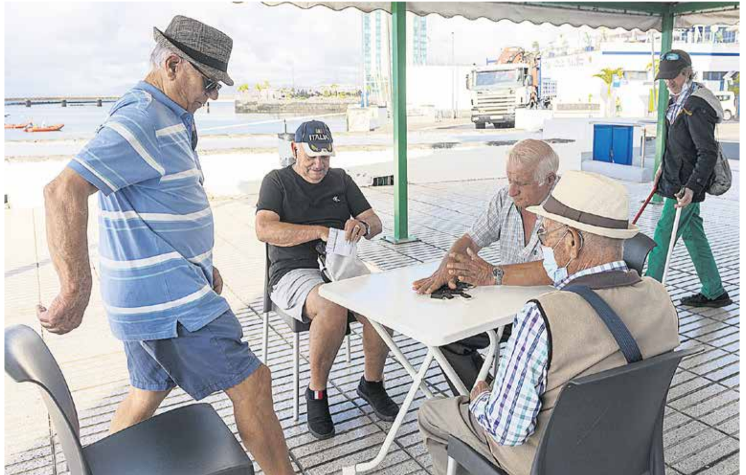
Un grupo de mayores echando una partida de dominó en Arrecife.

La Isla necesita un nuevo centro de alto requerimiento para personas mayores. La residencia de Tahíche no arranca y está diseñada con criterios ya obsoletos