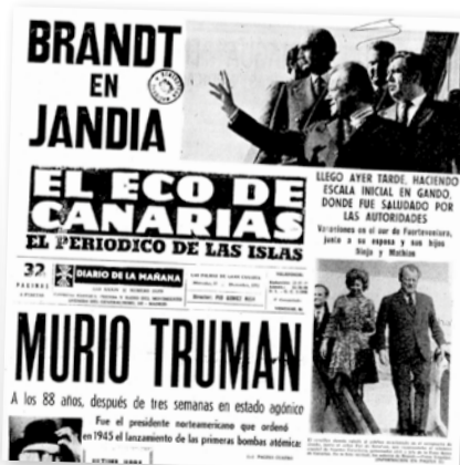
Fragmento de una portada del periódico 'Eco de Canarias' dedicada a la visita de Willy Brandt a Fuerteventura.

La visita de Willy Brandt fue un gran apoyo para los proyectos alemanes