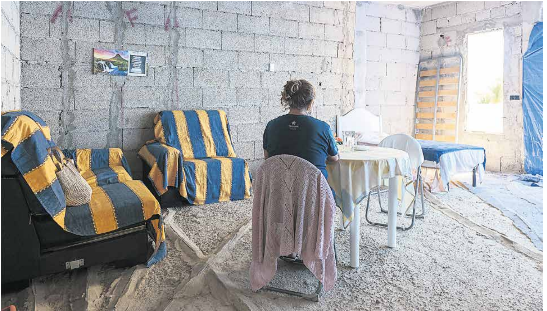
Una mujer, en el interior de la casa que ha ocupado.