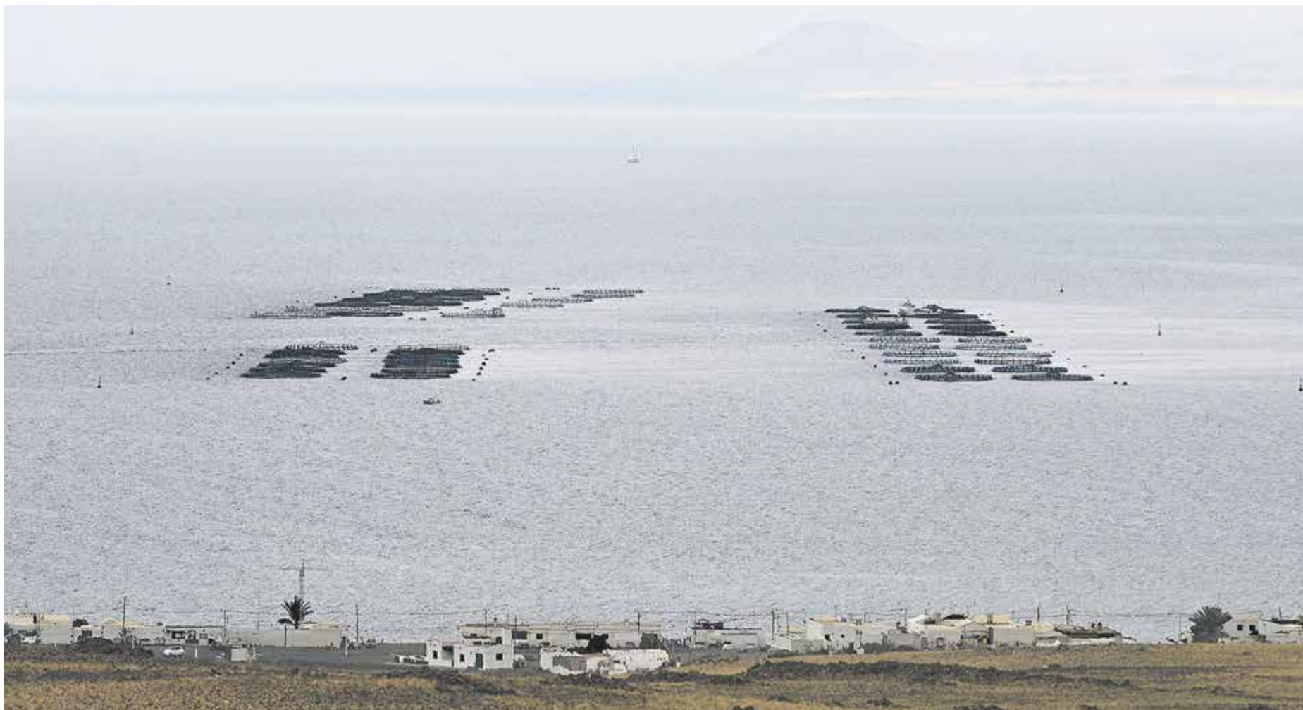
Jaulas marinas en Playa Quemada.