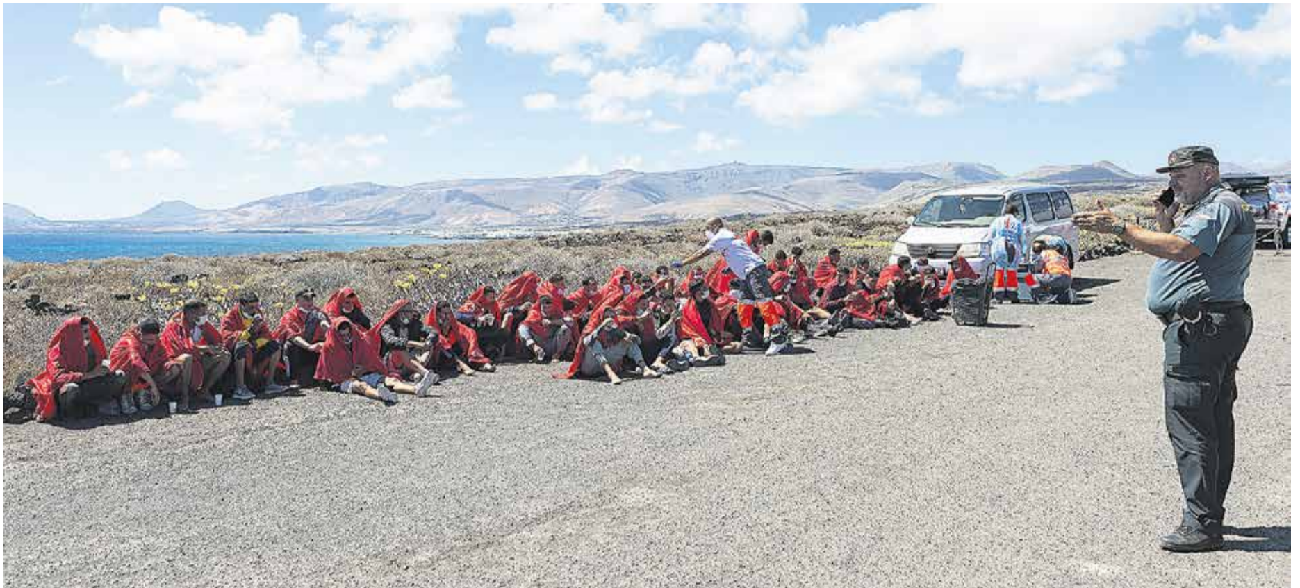
Migrantes procedentes de una embarcación son atendidos por voluntarios.