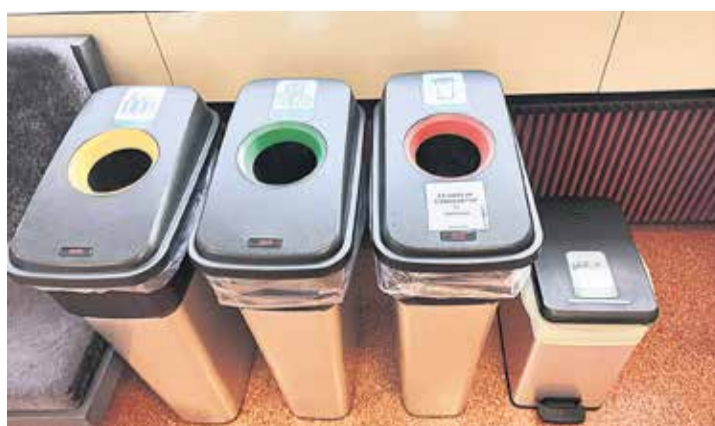
Imágenes de la visita al instituto islandés.

el espacio común. “También es cierto que es una sociedad muy nueva”, afirma. Pero durante gran parte del año no van casi por obligación, por las condiciones climatológicas. El aprendizaje es totalmente autónomo y se insiste en la responsabilidad de cada alumno o alumna en su propia enseñanza y en desarrollar la competencia de “aprender a aprender”.