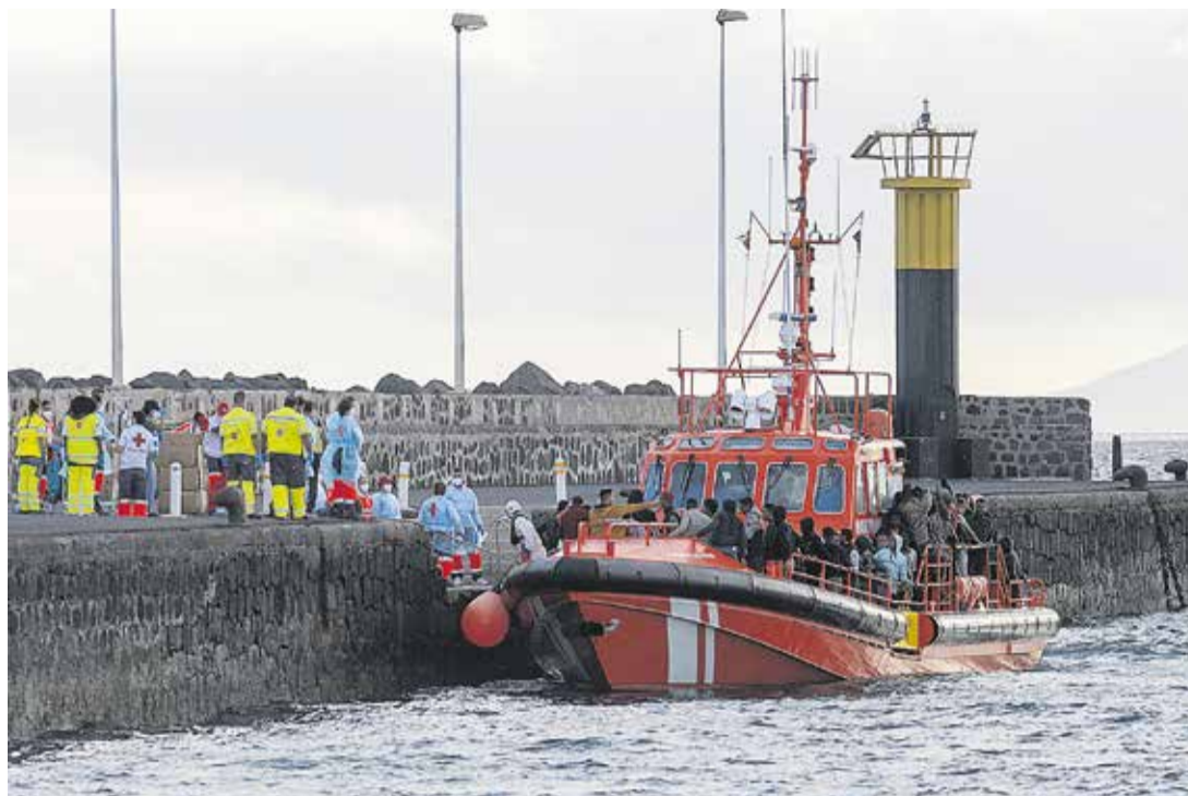
Salvamento Marítimo lleva a puerto a los ocupantes de una patera.