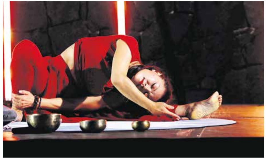
Un espectáculo cultural chino.