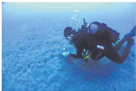
Buzos cogiendo muestras para el informe.

“El ecosistema del seabadal que encontramos en la zona de estudio se encuentra en estado de regresión”. El Ayuntamiento de Yaiza encargó otro estudio sobre las jaulas marinas de Playa Quemada, en esta ocasión a la empresa Innoceana, para conocer cómo afecta esta actividad al entorno de la localidad. Una de las conclusiones de este estudio es esa: que en los seabadales se ha encontrado “una gran cobertura de cianobacteria” que apuntaría a que los nutrientes que existen en esa zona aceleran el crecimiento de estos organismos microscópicos formando auténticas masas de cianobacteria que crecen sobre el seabadal.