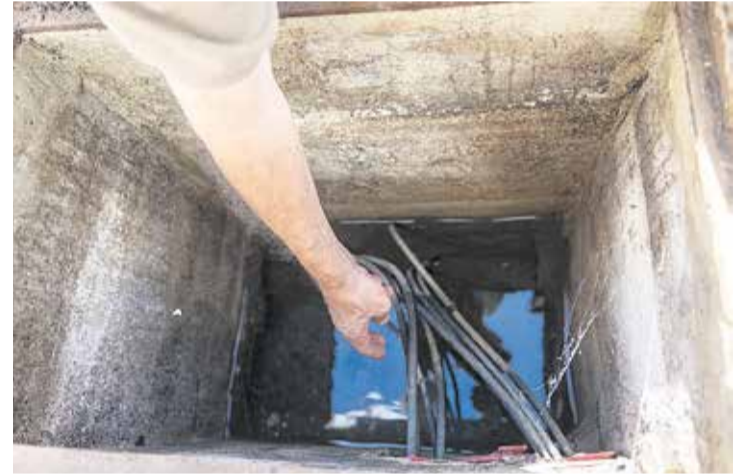
La arqueta de Endesa sigue llena de agua.