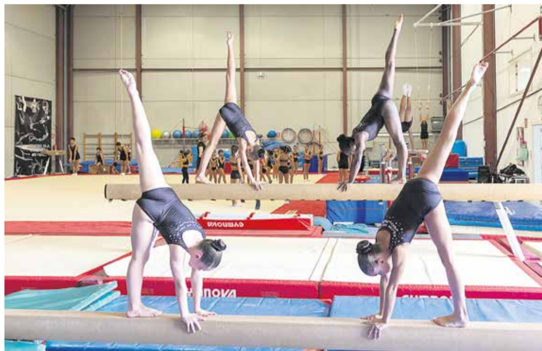
Gimnastas en un entrenamiento.