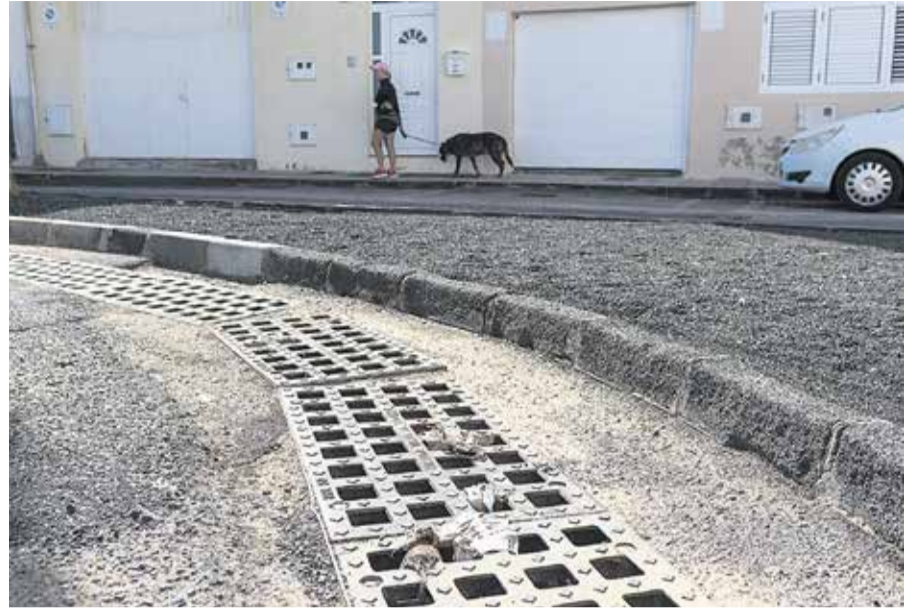
No se va el olor a agua estancada y a cloaca.