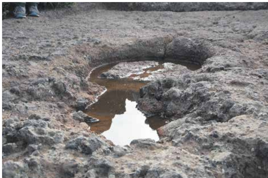
Detalle de la cazoleta aborígen con agua en la jornada en la que se tomó la imagen.

ba en el equinoccio de primavera”, agrega.