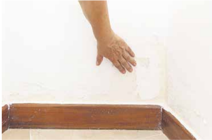
Concepción muestra una mancha de humedad.

El problema es que el agua no se va. Afecta a gran parte de la calle Víctor Hugo, en Argana Alta. La humedad de la calle se transmite a los edificios y a las casas. Lo que tampoco se va es el olor a agua estancada y a cloaca. “Lo han arreglado tres veces, pero no lo han arregla-