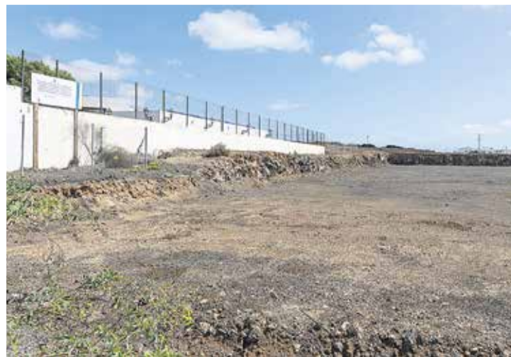
Terrenos donde se asentará la residencia de Tahíche.

Dice Corujo que el punto exacto está en basarse en las necesidades individuales, centrarse en las personas y no en las necesidades de la empresa que gestiona un centro o de la Administración. Es decir, basar la atención en la persona como tal y no como un objeto de cuidado. En ese camino de dar dignidad a las personas, caben muchas más opciones que las residencias. “Hace falta más atención social”, dice Elisa, y no olvidar que “respetar la dignidad de la persona es el fin último del cuidado”.