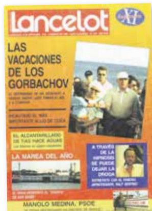
Portada dedicada a la visita de Gorbachov del semanario 'Lancelot'.

Para los primeros proyectos alemanes en las aún semi salvajes zonas de Morro Jable y Jandía la visita de Brandt fue todo un espaldarazo. El canciller estuvo en Fuerteventura entre el 27 de diciembre de 1972 y el 13 de enero de 1973 dejando numerosas portadas y fotos en playas y lugares turístico (visitó Timanfaya también). A su vuelta a Berlín, el político alabó el clima y la tranquilidad de Fuerteventura, completando una promoción realmente redonda. En 2017, coincidiendo con el 45 aniversario de su vi-