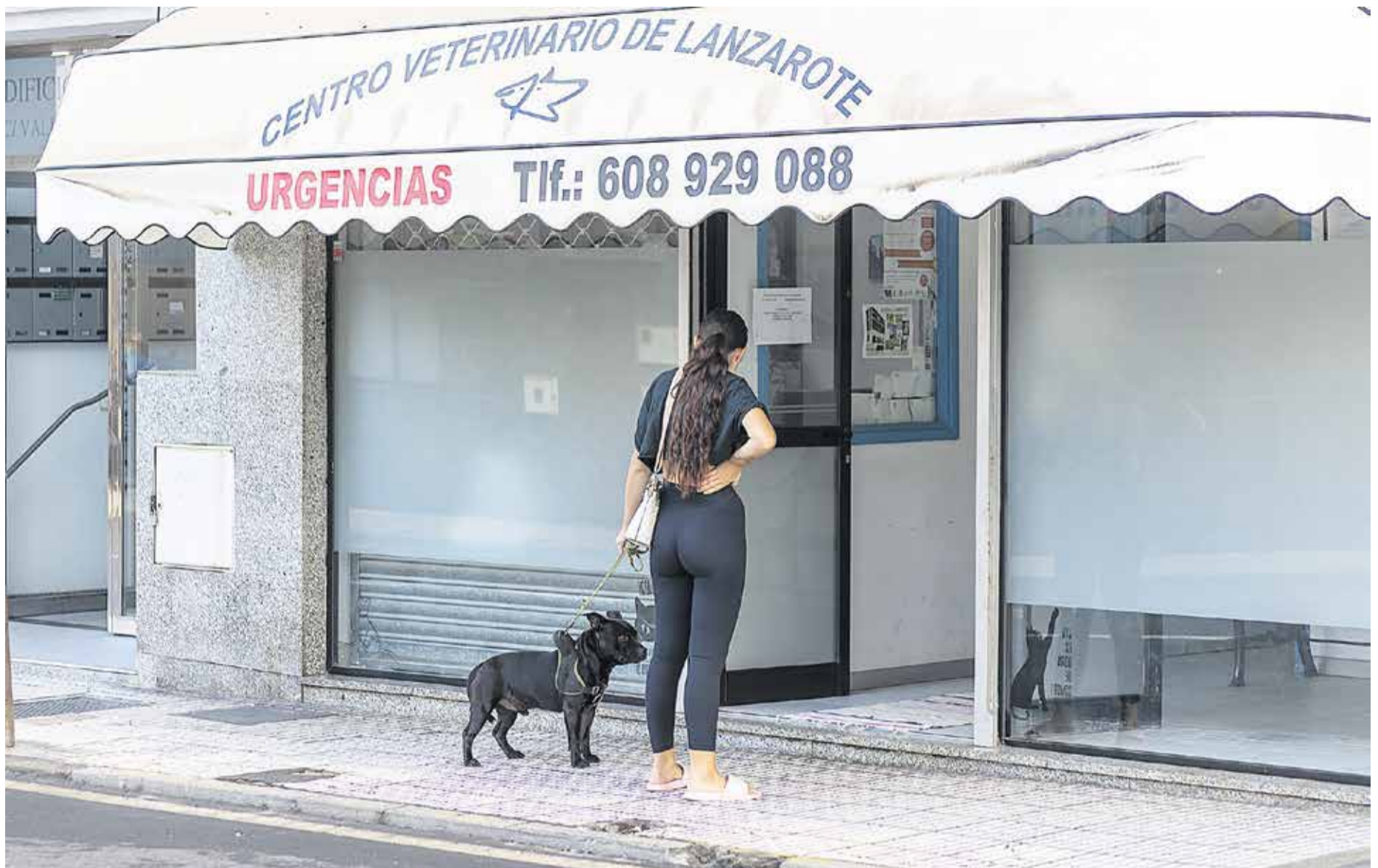
Una mujer con su perro a las puertas de un centro veterinario con cartel de urgencias.