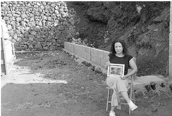
Fotografías que forman parte de la exposición.