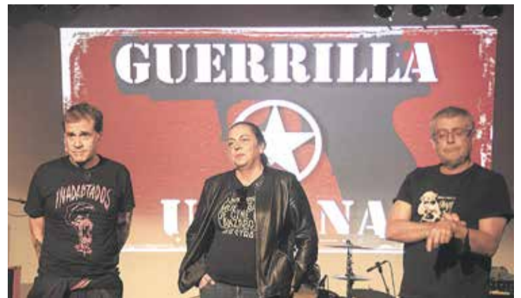
Cine Club Lanzarote presentó ‘Zurda’ en tres ciudades.