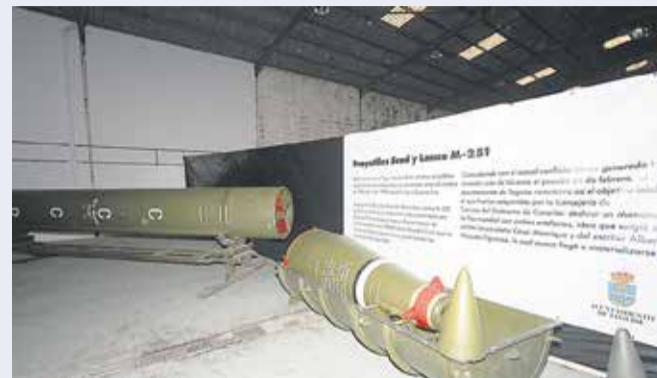
Imagen de los misiles ruso y estadounidense del 'Monumento de la Paz', que conserva el Ayuntamiento de Teguisse en el Complejo Agroindustrial.