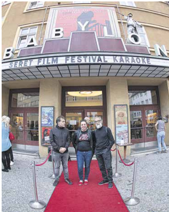
La delegación lanzaroteña en la proyección de ‘Paisajes audibles’, en Berlín.