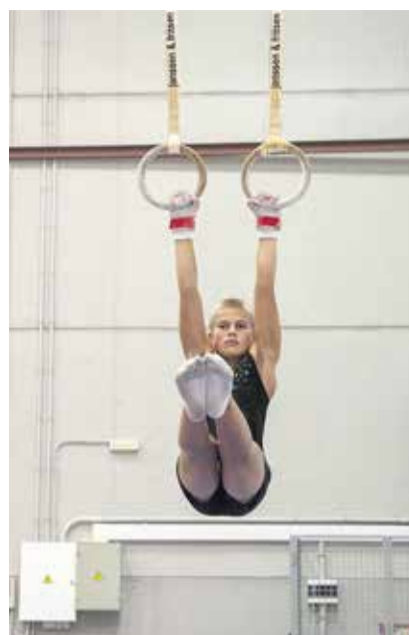
Ejercicio de anillas.

adelante. En estas categorías, un gimnasta de Centro de Alto Rendimiento entrena una media de seis horas diarias. Son gimnastas que viven en las residencias de esos centros y a los que también se les proporciona los medios necesarios para que puedan compaginar el deporte con los estudios. Sin embargo, los gimnastas que entrenan en el Club Isla de Lanzarote distribuyen su tiempo de otra manera, al