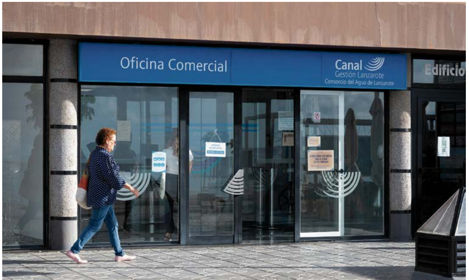
Oficina de Canal Gestión en Arrecife.

El Consorcio del Agua aprobó la revisión de las tarifas en dos ocasiones, para el periodo 2017-2019 y después para el periodo entre 2020 y 2024, pero la propuesta llegó a la Comisión de Precios de Canarias, que es un órgano colegiado integrado en la Consejería de Industria, Comercio y Consumo, y se rechazó la actualización de las tarifas por dos motivos: por el superávit que tuvo la empresa en el año 2019, ya que las tarifas no se pueden subir si hay superávit porque el servicio debe ser autofinanciable, y por el alto volumen de pérdidas de agua en la red debido a “la ineficiente gestión llevada a cabo que implica que cada año se obtengan mayores porcentajes de volúmenes de agua no registrada”.