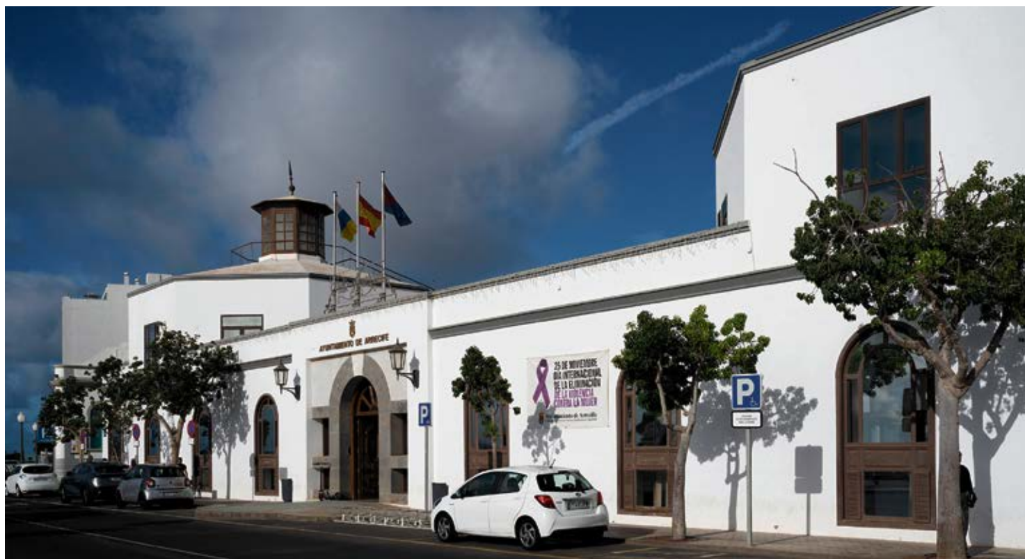
Fachada del Ayuntamiento de Arrecife.

Los reparos son habituales, pero los argumentos para esos