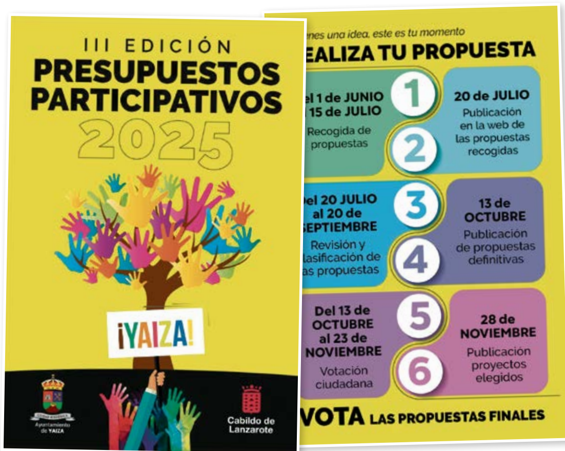
Carteles de la convocatoria.

Por último, hay propuestas centradas en la digitalización y conectividad, como acondicionar zonas de wifi gratuito en espacios públicos y edificios municipales, y en la mejora de servicios como la colocación de contenedores de vidrio en puntos comerciales. Estas propuestas apuntan al objetivo de