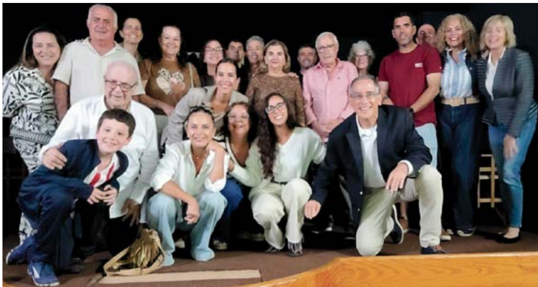
Algunos de los Viñoly que asistieron a la presentación en Teguiise.

Señala Hernández que empezaron este trabajo por el gran interés que tenían varias personas, principalmente de Uruguay, que llevan ese apellido,