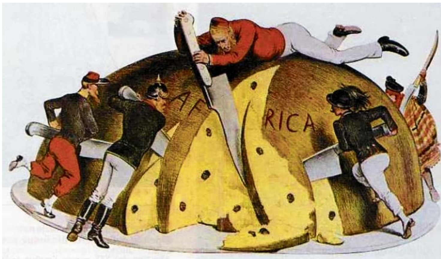
Viñeta histórica del "reparto de África" realizado por los dirigentes europeos.

La aventuras y desventuras españolas en el continente africano siempre han afectado especialmente a Lanzarote y Fuerteventura