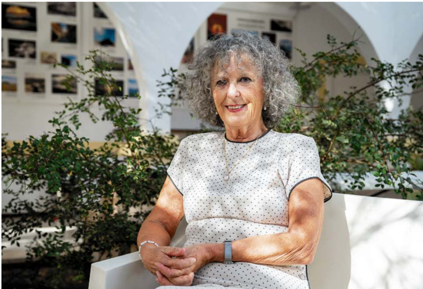
La psicoanalista estudia los impactos de la digitalización en el comportamiento social.

-Exacto, que se crean para dar respuestas a la caren-