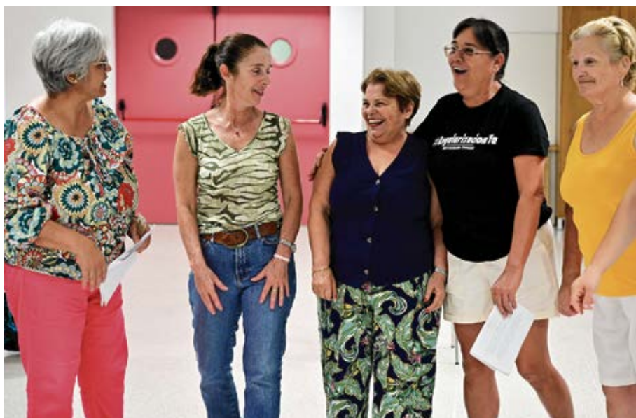
Las actrices ensayan una escena de cara al estreno del 27 de noviembre.