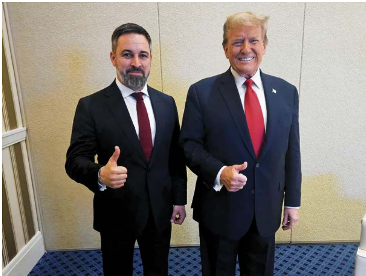
Santiago Abascal y Donald Trump.

Lo intentó en las elecciones generales de Canadá hace unos meses, con resultados nefastos para su patrocinado. El ganador de los comicios y ahora primer ministro supo envolverse en la bandera como respuesta al propósito expansionista del vecino del sur. La suerte de Canadá es que, aun siendo EEUU su principal socio comercial, no padece una dependencia del vecino en lo económico y mucho menos en lo psicológico. No era este el caso de Argentina, que acudía a los comicios legislativos en una situación financiera angustiosa que a corto plazo solo tenía y tiene remedio con el rescate del Tesoro estadounidense. Y Trump se lo dejó muy claro a los votantes: los 20.000 millones de dólares (ampliados al doble) destinados a frenar el desplome del peso argentino solo llegarían en caso de que el presidente Javier Milei, su aliado y vasallo, lograra un triunfo lo suficientemente claro para poder implementar su agenda de reformas. Vistos los resultados, sobre todo comparados con los que se produjeron en las elecciones en la provincia de Buenos Aires, solo unas