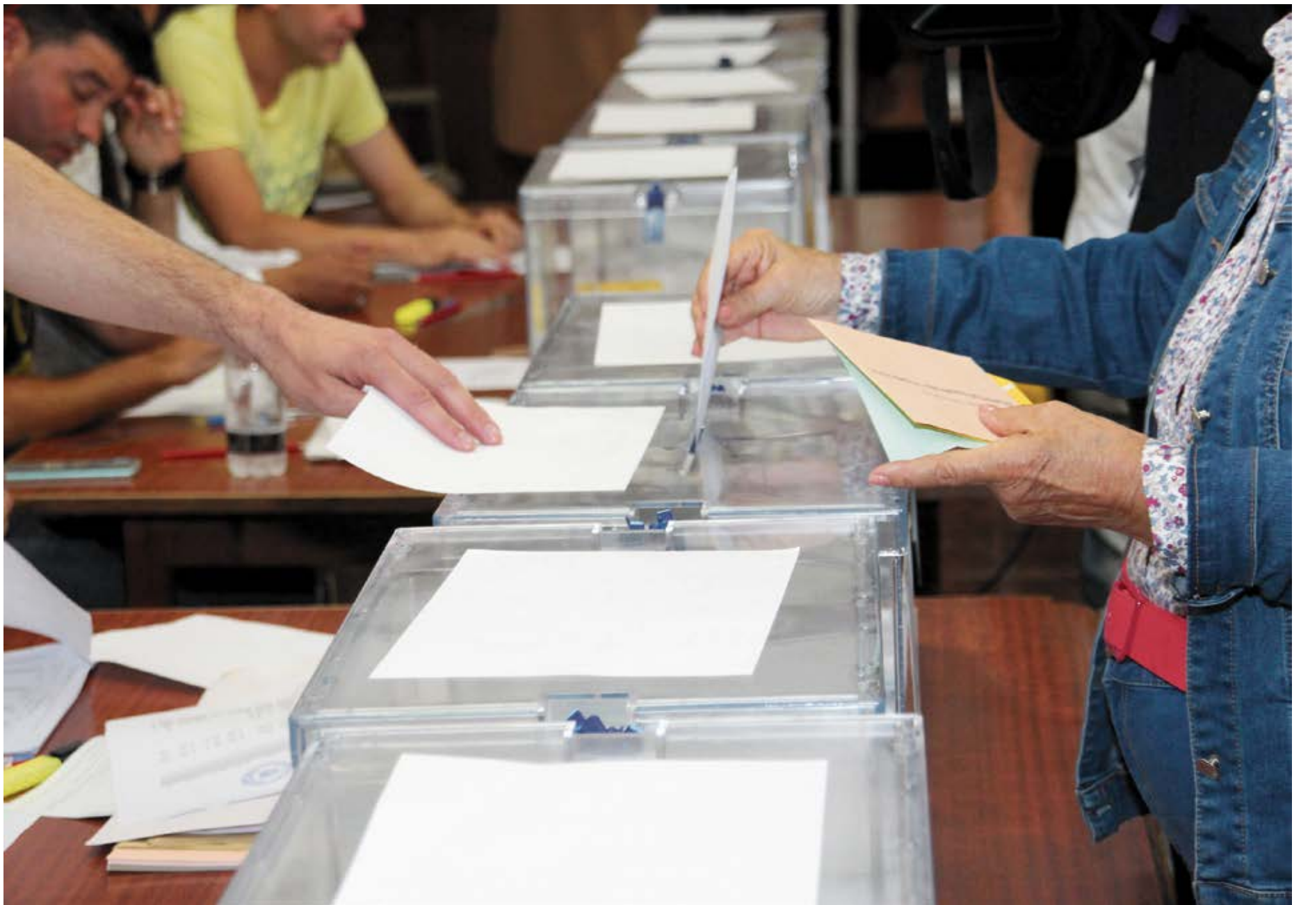
Una ciudadana deposita su voto en la urna.