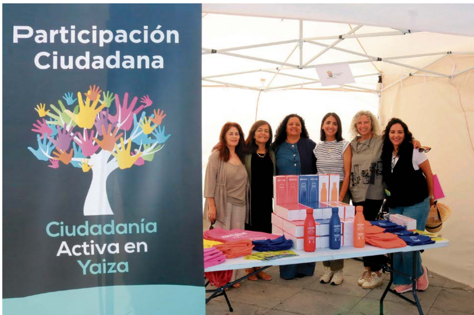
Equipo de Participación Ciudadana Yaiza.