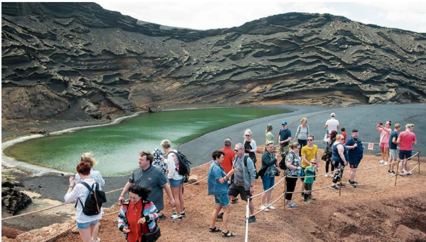
Visitantes en el Charco de los Clicos.

Decía ese estudio que “la evolución de la Isla sigue siendo muy preocupante, y la situación actual, evaluada por una batería de indicadores que informan del período 1997-2000, es extremadamente frágil” debido al “desbordamiento de la presión humana” y el “crecimiento turístico” “desbordando los límites tolerables e induciendo todo una serie de desequilibrios generales en los ecosistemas básicos”.