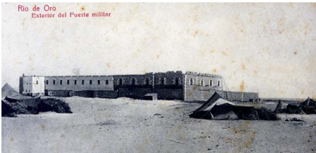
Postal de principios de siglo de un acuartelamiento español en el Sáhara.

En Canarias, y especialmente en Lanzarote y Fuerteventura, el horizonte de la descolonización planteaba un grave problema para las prósperas fábricas conserveras. El llamado banco pesquero canario-sahariano, uno de los más ricos del Atlántico, era el gran recurso de la industria marinera del Archipiélago. La conflictividad pronto llegó a las aguas de pesca, con sabotajes, secuestros y ataques. El Frente Polisario estuvo especialmente activo en los años 70. El caso más dramático fue el ataque al barco Cruz del Mar, en el que murieron ametrallados siete pescadores de Lanzarote. Se produjeron huelgas, manifestaciones, reuniones patronales y encuentros internacionales, pero en el nuevo contexto el destino de la pesca fue la paulatina desaparición.