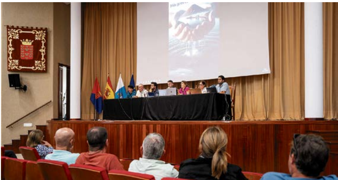
Los participantes en la Jornada ‘Más grifo, menos plástico’.

Para Betancort, la ósmosis es una salvaguarda contra los contaminantes porque las membranas eliminan estos compuestos. Hay 79 puntos de control, algunos en interiores si se trata de edificios públicos, como residencias o colegios, sitios más vulnerables. Frente a esto, personas del público aseguraron que el agua sale totalmente turbia de sus grifos y se puso sobre la mesa la cuestión del mantenimiento de los interiores, tanto de los aljibes como de los grifos y de las cañerías. Algunos de ellos están al aire, sin tapa, mal mantenidos o hechos con materiales poco adecuados.