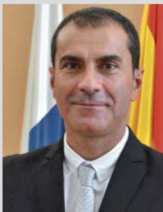
MAME FDEZ. Marea Viva

“A principios de año debería estar claro si va a ir cada uno por su lado o si vamos a tener esa federación de partidos municipales”