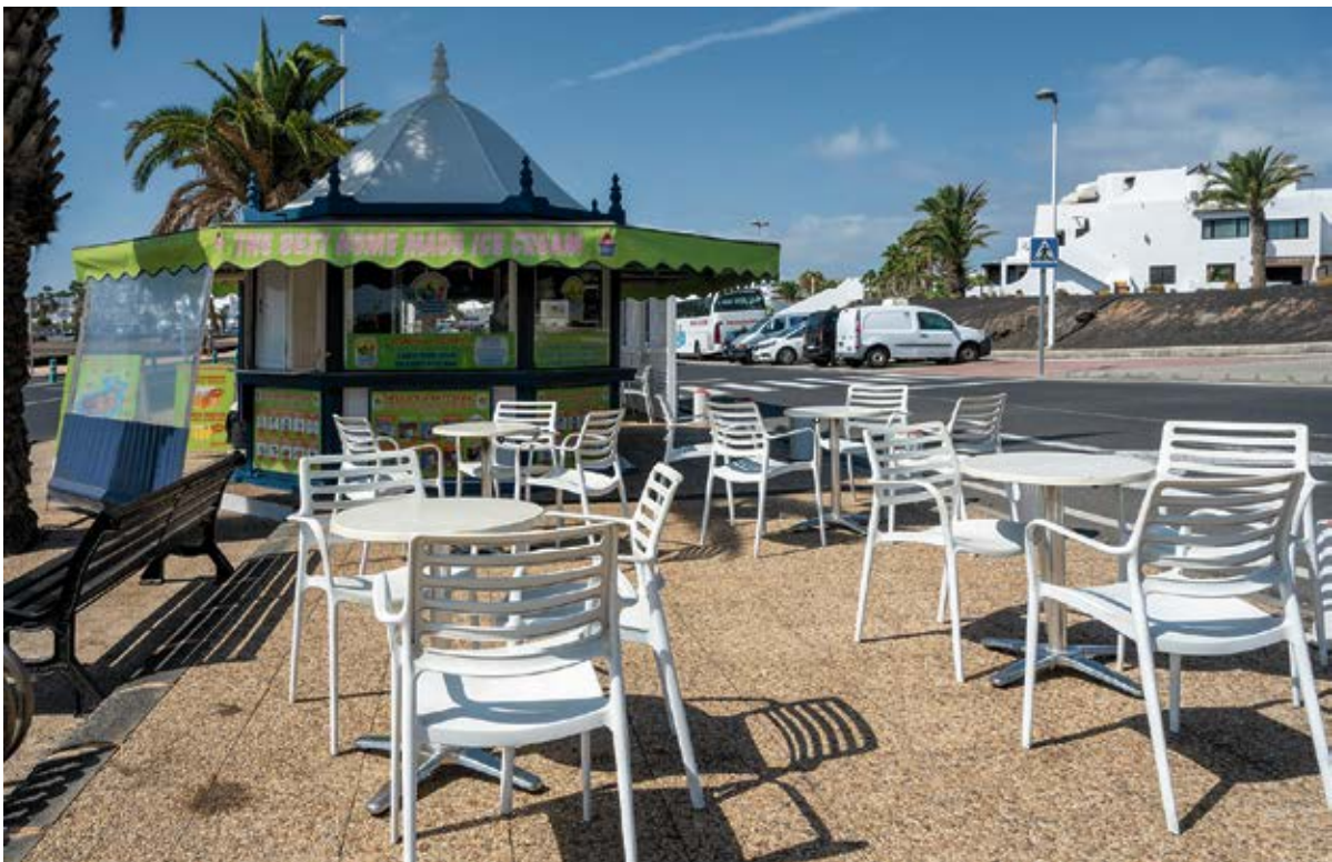
Terraza de la Heladería Helathlon.