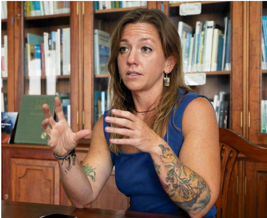
Momento de la entrevista en la biblioteca de la Casa de los Arroyo, sede de la Reserva de la Biosfera.

—La primera vez que viajé a Canarias sentí inmediatamente una conexión muy fuerte con su territorio, y especialmente con Lanzarote. Alquilé un coche y pasé días recorriendo la Isla, admirando sus volcanes, playas, cuevas, riscos, Jameos, plantas, cactus, conchas y rocas, asombrada de que toda esa belleza pudiera existir en la Tierra. Me enamoré perdidamente y supe que siempre sería un lugar especial para mí. Unos años más tarde, al encontrar este programa de estudios, elegí Lanzarote para mis prácticas, por esta conexión que te comento. Quería estudiar los aspectos culturales y ecológicos únicos de un lugar prácticamente sin agua, que históricamente ha sido un importante punto de acceso al mundo. Hay muchas lecciones cruciales que podemos aprender de esto, ahora y en el futuro, especialmente en este momento de la historia de la humanidad. Siempre he sentido un gran amor por las islas, y este amor se ha intensificado durante mi estancia en Canarias y Lanzarote de este verano. Son lugares especiales,