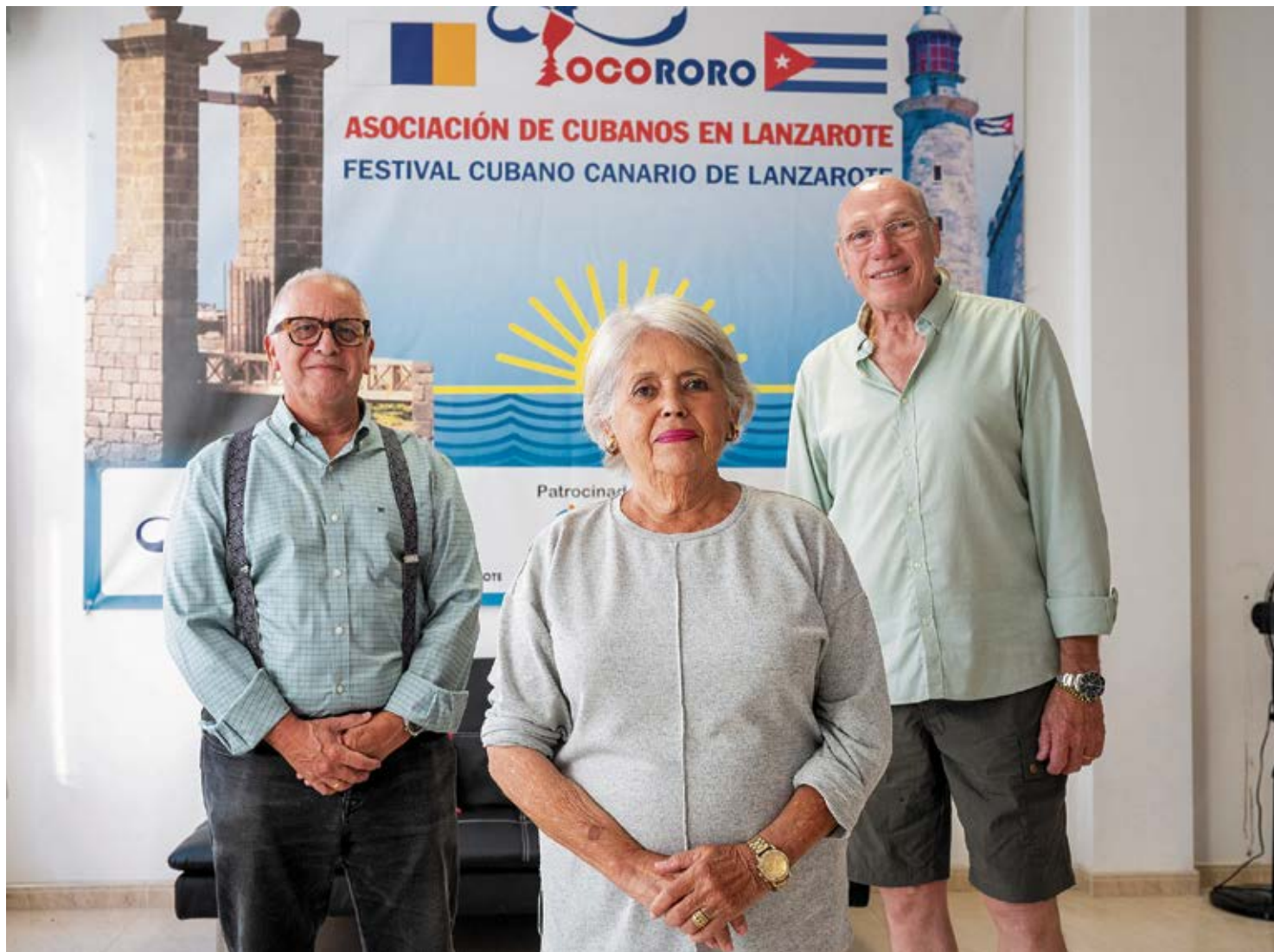
Miembros de la junta directiva en Casa Cuba.