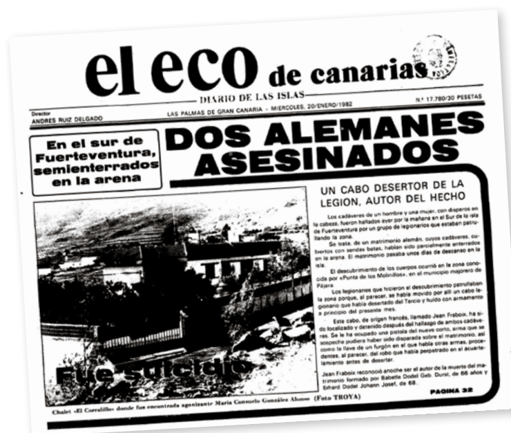
Portada del periódico 'El Eco de Canarias' de 1982 dedicada al asesinato de dos alemanes por parte de un desertor de la Legión.

Muchos analistas han señalado que una de las peores secuelas de la descolonización fue la de crear graves problemas fronterizos. Grandes conflictos internacionales como el de Cachemira, entre India y Pakistán, o la larga disputa de Palestina e Israel tienen su origen, entre otras causas, en la descolonización. África se ha visto especialmente afectada por guerras con raíces coloniales (Angola, Ruanda, Biafra, Sudán...), siendo uno de los principales motivos de la inestabilidad y la emigración que azotan al continente vecino. En muchos casos y por múltiples motivos, el ansiado sueño de la independencia terminó tornándose en pesadilla. Por poderosas razones geográficas e históricas, Fuerteventura y Lanzarote seguirán pendientes de lo que ocurra en esta esquina del desierto de arena más grande del Planeta.