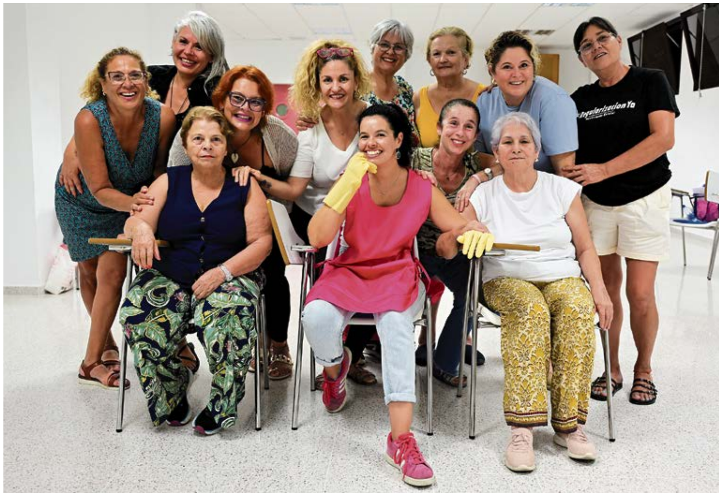
Las actrices de ‘Arriba las que limpian’ durante los ensayos de la obra.

El miedo de Floren a contar “cosas que son verdad”, como ella misma las define, es compartido y comprendido por sus compañeras de profesión, inde-