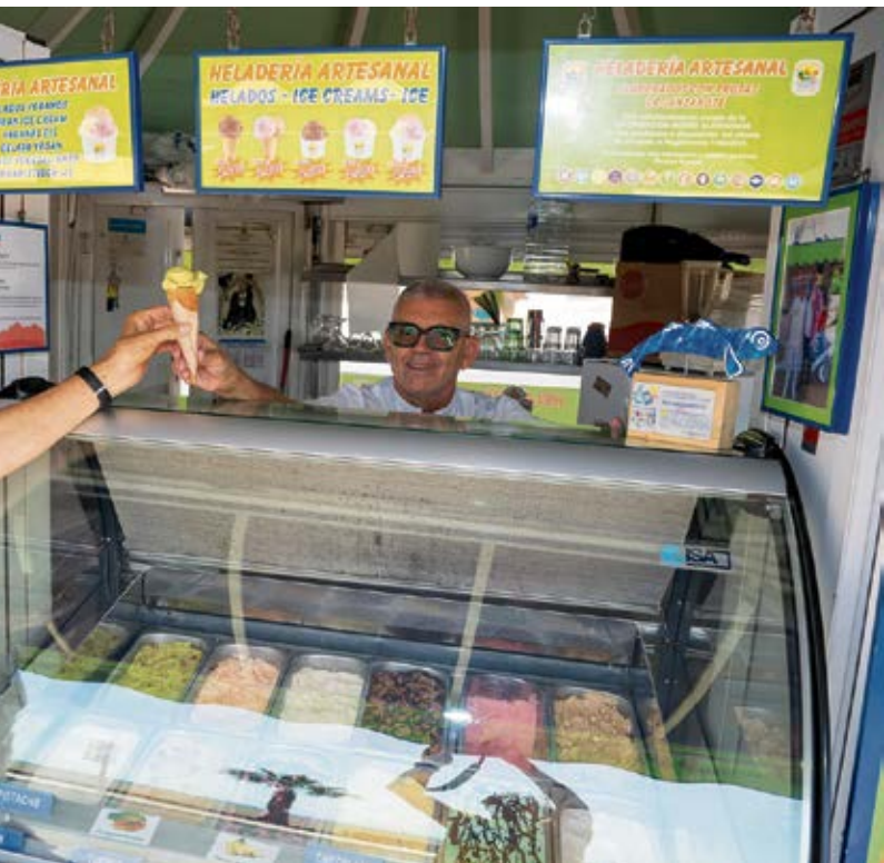
Atendiendo a un cliente.