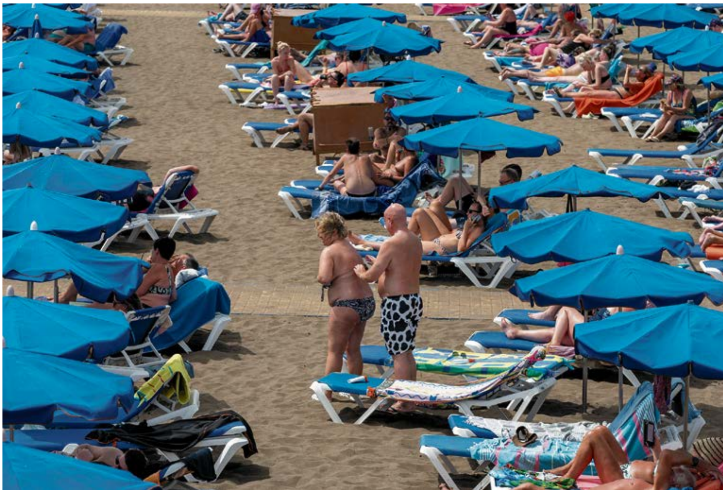
Turistas en Playa Grande.

En Lanzarote, la patronal local siempre se ha mostrado en contra de cualquier iniciativa de este tipo. Nada raro teniendo en cuenta que incluso se mostró en contra de la subida de los precios de los Centros Turísticos. Y nada nuevo, teniendo en cuenta que hace seis años, cuando se