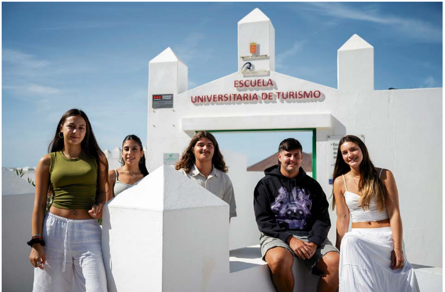
Alumnado de cuarto curso de la Escuela Universitaria de Turismo de Lanzarote.