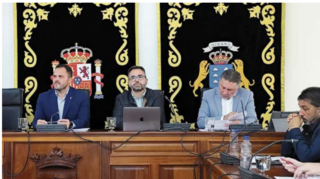
Pleno del Ayuntamiento de Arrecife.

Esta modificación presupuestaria propuesta se financia con cargo al remanente líquido de Tesorería. Según este informe, de la liquidación del presupuesto del ejercicio 2024 resultó un remanente de Tesorería para gastos generales por importe de 75,7 millones de euros, pero con cargo a esos fondos ya se han financiado otras seis modificacio-