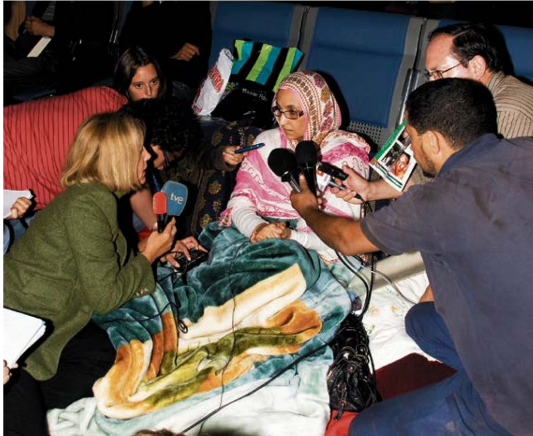
Aminatu Haidar, activista saharauí, durante su expulsión al aeropuerto de Lanzarote en 2009.

La salida del Sáhara también provocó considerables pérdidas comerciales y económicas: multitud de pequeños empresarios canarios tuvieron que “desinvertir”, tras décadas de negocios en la hasta entonces provincia española. A partir de finales de 1975 se abrió otro frente, con el traslado de la Legión a varias zonas de Canarias y de la Península, pero especialmente a la isla de Fuerteventura. Maxorata era aún una isla con una población pequeña, por lo que la aparición de miles de legionarios alteró totalmen-